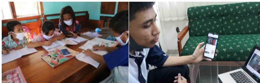
Gambar 4. Instalasi Google Meet

Kegiatan berupa pemberian edukasi mengenai tata cara instalasi google meet secara offline berhasil dilakukan di mana para siswa mampu menginstall google meet diperangkat handphone. Dokumentasi selama kegiatan instalasi google meet dapat ditunjukkan pada Gambar 4.