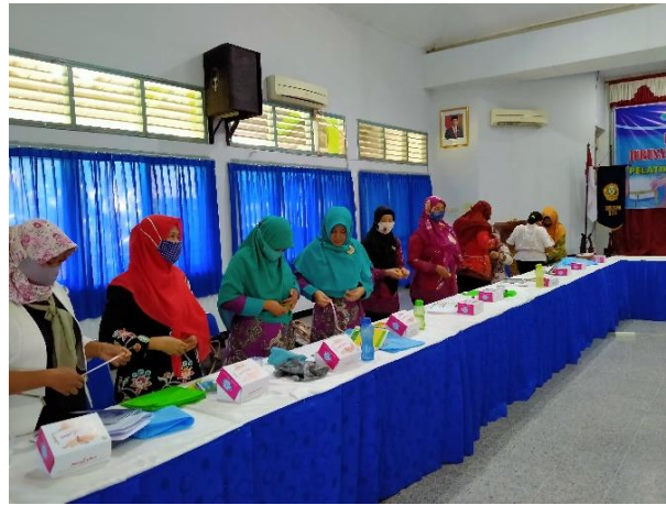
Gambar 3. Praktek Pengukuran Status Obesitas