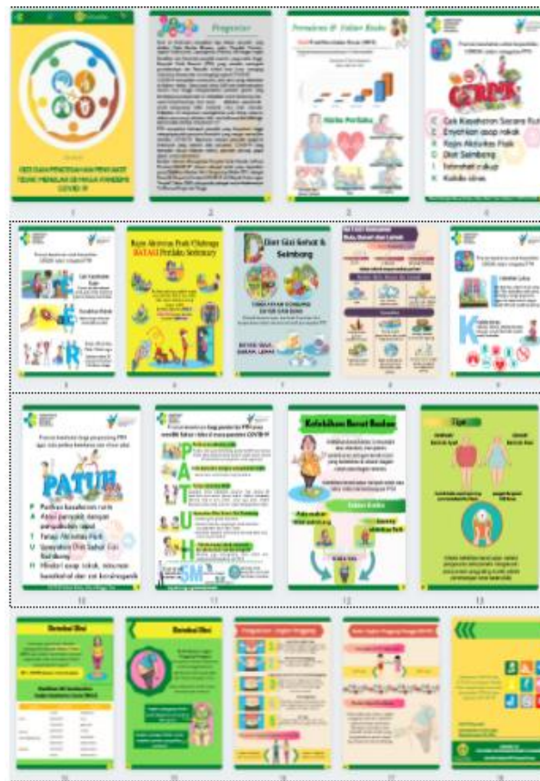
Gambar 5. Booklet Media Kegiatan

Booklet telah mendapatkan pengakuan hak cipta oleh Direktur Jenderal Kekayaan Intelektual dengan nomor pencatatan 000248190. Demonstrasi dan praktik pengukuran RLPP berlangsung singkat, maka perlu media pendamping lain seperti video tutorial yang dapat diberikan kepada peserta selain booklet yang berisi panduan melakukan pengukuran.