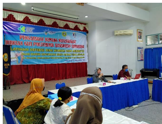
Gambar 1. Pembukaan Resmi Kegiatan Pengabdian kepada Masyarakat

Kegiatan diawali dengan laporan Ketua Pengabdi dilanjutkan dengan Sambutan dan Pembukaan Resmi oleh Ketua Jurusan Gizi sebagaimana tersaji pada Gambar 1 berikut.