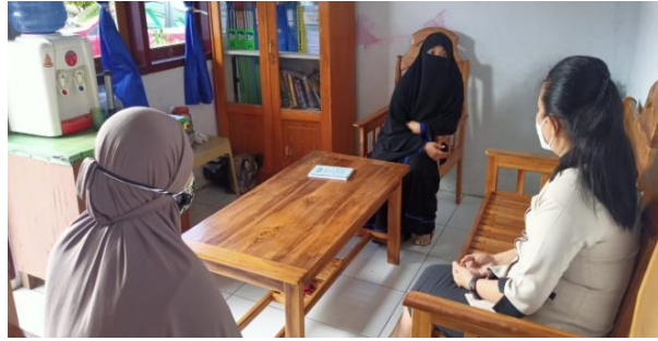
Gambar 6. Kegiatan pembentukan PIK-KRR

PIK-KRR bersama pihak Dinas Pengendalian Penduduk dan KB, pihak pesantren dan tim pelaksana pengabdian kepada masyarakat. Pembentukan PIK-KRR berlangsung seperti pada Gambar 6 berikut.