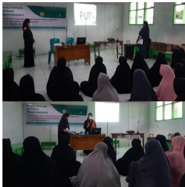
Gambar 3. Pemutaran Video Edukasi dan Penyuluhan

Setelah pengisian kuesioner dilanjutkan dengan pemutaran video tentang Pendewasaan Usia Perkawinan dan pemberian penyuluhan seperti pada Gambar 3 berikut.