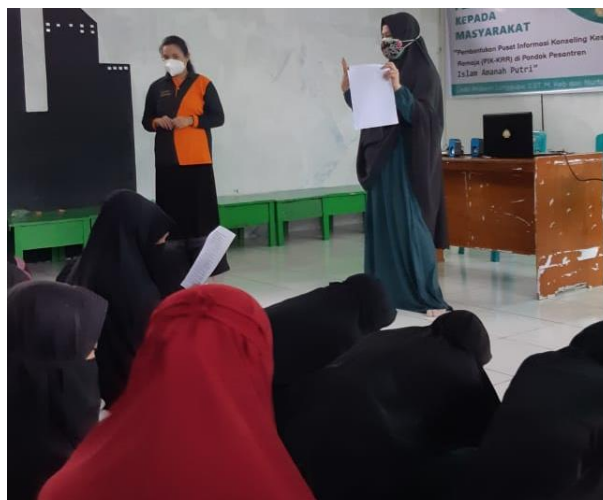
Gambar 4. Pengisian Kuesioner Posttest

Sebagai tindakan evaluasi untuk kegiatan ini dilakukan pengisian kuesioner posttest seperti pada Gambar 4 berikut.