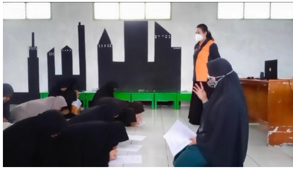
Gambar 2. Pengisian Kuesioner Pretest

Setelah pengisian kuesioner dilanjutkan dengan pemutaran video tentang Pendewasaan Usia Perkawinan dan pemberian penyuluhan seperti pada Gambar 3 berikut.