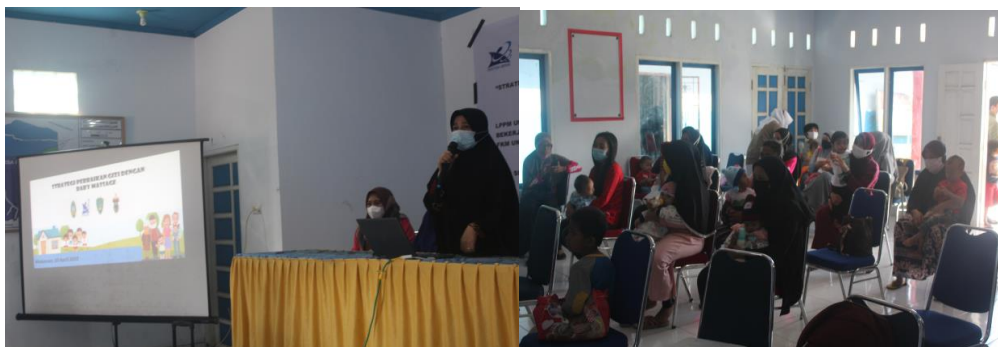
Gambar 3. Pelaksanaan kegiatan Sosialisasi

Metode pelaksanaan dilaksanakan melalui ceramah tanya jawab dengan peserta kegiatan. Pemaparan yang dilakukan menggunakan bantuan powerpoint yang dibuat menarik untuk dapat menarik perhatian peserta sosialisasi, seperti terlihat pada Gambar 3.