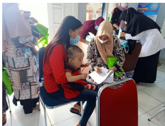
Gambar 4. Kegiatan Evaluasi Kegiatan

Kegiatan diakhiri dengan evaluasi kegiatan melalui sesi tanya jawab dan pengisian kuisioner postes kepada para peserta sosialisasi, seperti terlihat pada Gambar 4.