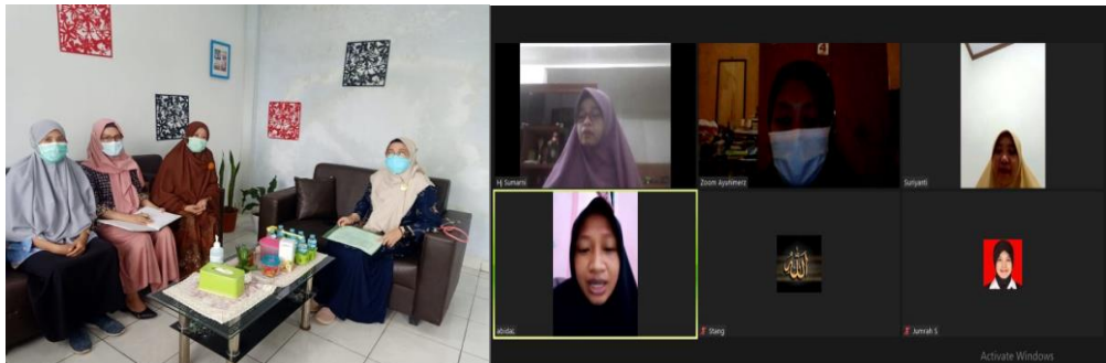
Gambar 2. Pertemuan dengan Kepala Puskesmas dan Rapat Virtual Tim PKM

Tahap persiapan diawali dengan permohonan ijin pelaksanaan kegiatan di Puskesmas Moncongloe. Selanjutnya dilakukan rapat koordinasi tim pelaksana kegiatan secara virtual, seperti terlihat pada Gambar 2.