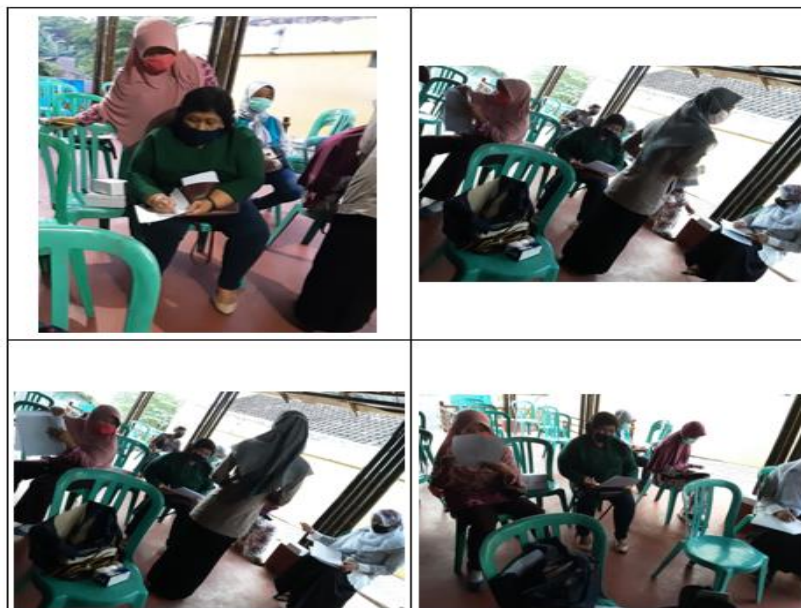
Gambar 2. Dokumentasi Kegiatan pada Tahap Evaluasi dengan Penilaian pre-test dan post-test