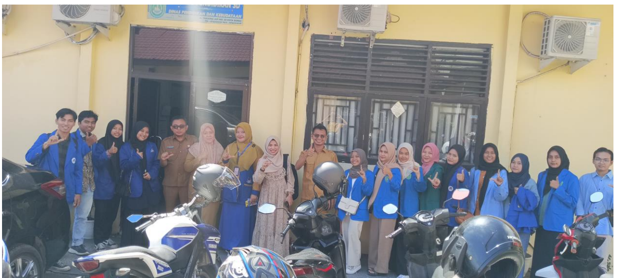
Foto dengan pihak dinas Pendidikan kota dumai