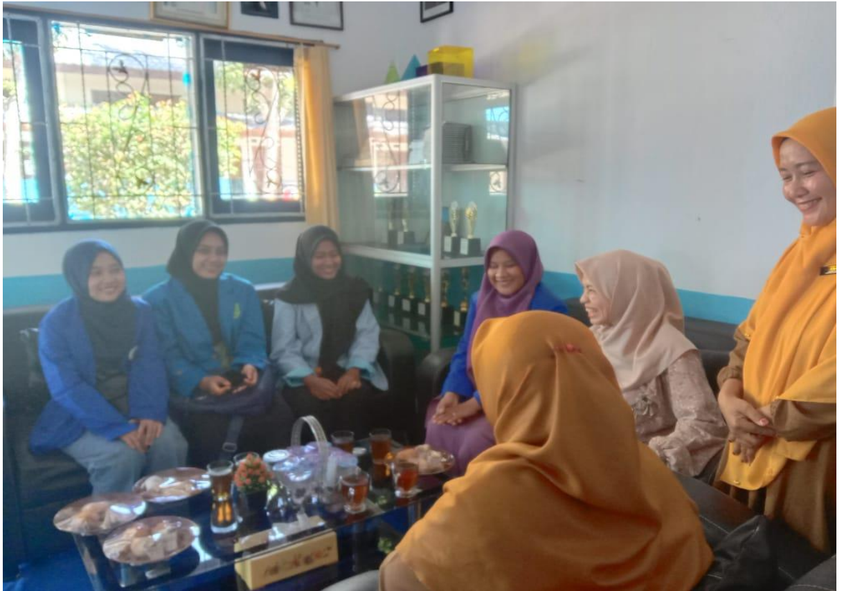
Foto dengan kepala sekolah dan guru pamong.