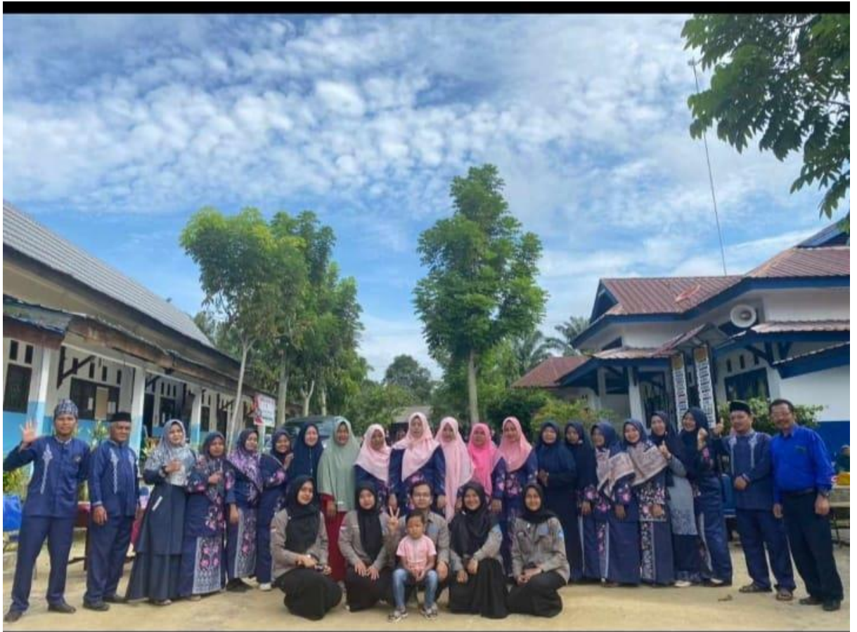
Foto penutupan KM 6 di sekolah