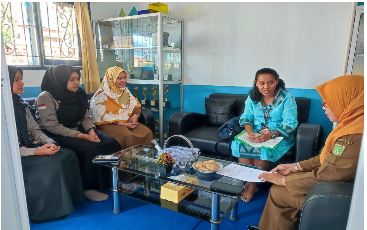
Foto dengan pihak BPMP Provinsi Riau