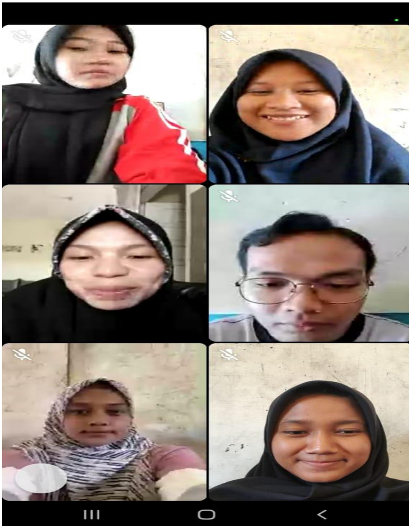
Foto DPL dan para mahasiswa KM 6