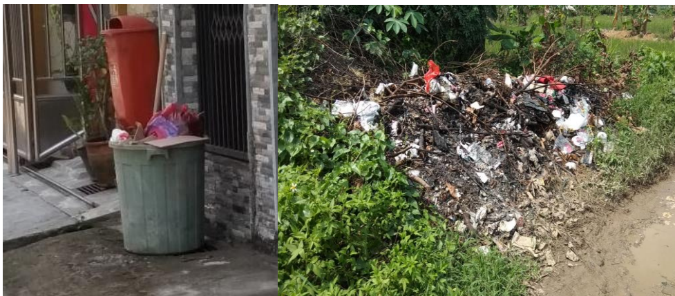
Gambar 2. Sampah Perumahan dan Bagian Belakang Perumahan Yang Dijadikan Tempat Pembuangan Sampah Liar

Pengolahan limbah menjadi menjadi salah satu permasalahan di daerah perkotaan, terutama di kawasan padat penduduk (Saputra, 2020). Kawasan perumahan Coco Garden, terletak di Klapanunggal Kabupaten Bogor merupakan perumahan sederhana yang sebagian besar masyarakatnya memasak makanannya sendiri, dan beberapa warga memiliki usaha warung nasi, yang disediakan untuk buruh pabrik yang bekerja sebagai pemecah gunung kapur. Hal ini menyebabkan limbah rumah tangga yang berasal dari dapur selalu menumpuk di tempat sampah. Sampah yang menumpuk lama kelamaan dapat mengganggu suasana, lingkungan kumuh, kotor, menyebabkan banjir saat musim hujan, dan mudah terbakar saat musim kemarau (Sholahudin, 2019), seperti terlihat pada Gambar 2.