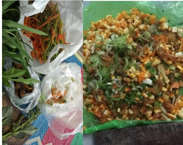
Gambar 7. Limbah Rumah Tangga berupa Sisa Sayuran Sebelum dan Sesudah Dicincang Untuk Memudahkan Proses Pengomposan

Selain pengenalan alat dan bahan, narasumber juga menjelaskan bahwa pupuk yang dihasilkan dari kegiatan pelatihan ini merupakan pupuk yang berkualitas baik, dan bernilai jual jika dilakukan dengan prosedur yang tepat. Dengan sampah sisa sayuran yang selama ini dianggap hanya sampah dan terbuang ternyata memiliki nilai ekonomis. Bagian batang dan akar dari sayuran terbentuk dari nitrogen yang merupakan nutrient utama tumbuhan yang bisa menjadi sumber energi bagi mikroba decomposer (Handayani, 2019), seperti terlihat pada Gambar 7.