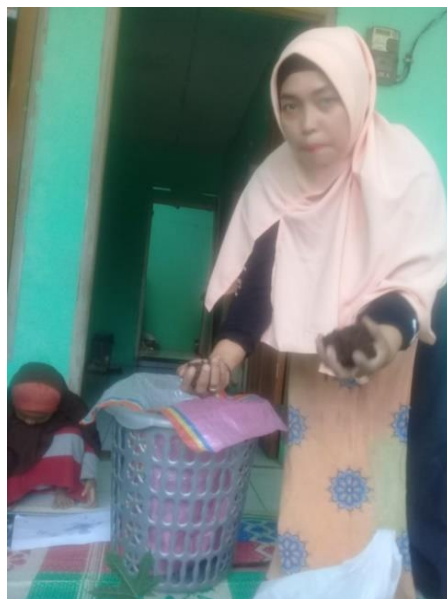
Gambar 6. Pengenalan Keranjang Takakura Yang Ditutupi Dengan Breathable Fabric

Usai paparan materi, narasumber melakukan demonstrasi dan praktek pengelolaan limbah rumah tangga (organik) dengan teknik pengomposan takakura. Hasil akhir dari pengelolaan sampah organik menjadi pupuk kompos sangat berguna bagi pertumbuhan tanaman. Narasumber memulai dengan mengenalkan alat dan bahan yang digunakan. Narasumber juga menjelaskan fungsi dari alat dan bahan tersebut, dan mengapa harus menggunakan alat dan bahan tersebut. Penggunaan breathable fabric untuk menutup keranjang takakura berfungsi untuk mengontrol pertukaran udara/aerasi selama proses pengomposan (Sarmidi, 2016), seperti terlihat pada Gambar 6.