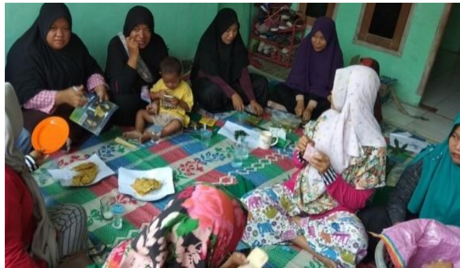
Gambar 3. Ibu-ibu Rumah Tangga Menyimak Sosialisasi dan Persiapan Alat dan Bahan Yang Dibutuhkan Untuk Pelatihan