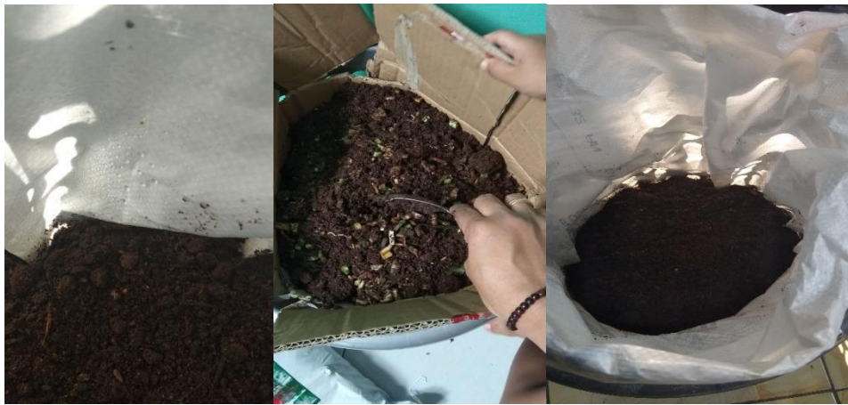
Gambar 8. Hasil Pengomposan Limbah Sayuran Selama 3 Kali Monitoring Dalam Sebulan

Adapun pemantauan dilakukan untuk melihat kemajuan seperti limbah organik yang digunakan, peletakkan keranjang, posisi bantalan penahan air, kadar air, dan suhu udara pada keranjang, keberadaan serangga, dan bau yang ditimbulkan dari dalam keranjang. Proses pengomposan yang berhasil ditandai dengan berubahnya limbah organik menjadi bahan yang menghitam dan tidak terasa lengket ketika dipegang dengan tangan kosong (Ridwan et al., 2014), seperti terlihat pada Gambar 9.