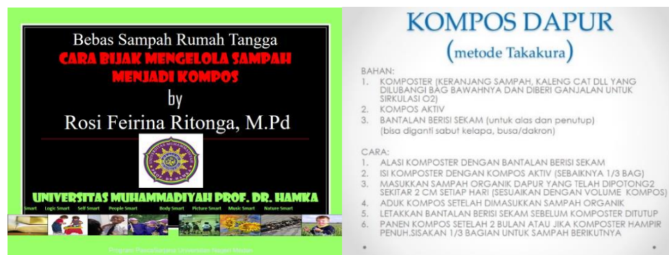
Gambar 4. Materi yang Diberikan Kepada Peserta Cara Mengelola Limbah Rumah Tangga Menjadi Kompos

Kegiatan pelatihan diawali dengan pembukaan oleh ketua pelaksana dan sambutan dari perwakilan peserta kegiatan. Jumlah peserta yang diundang adalah 20 orang, namun pada saat pelaksanaan hanya 16 orang yang dapat hadir. Saat memberikan kata sambutan, peserta merasa sangat senang dengan kedatangan Tim Pengabdian. Dengan adanya pelatihan ini, mereka berharap permasalahan sampah yang terdapat di Coco Garden dapat teratasi, dan masyarakat menjadi sadar akan kebersihan dan kesehatan lingkungan, seperti terlihat pada Gambar 4.