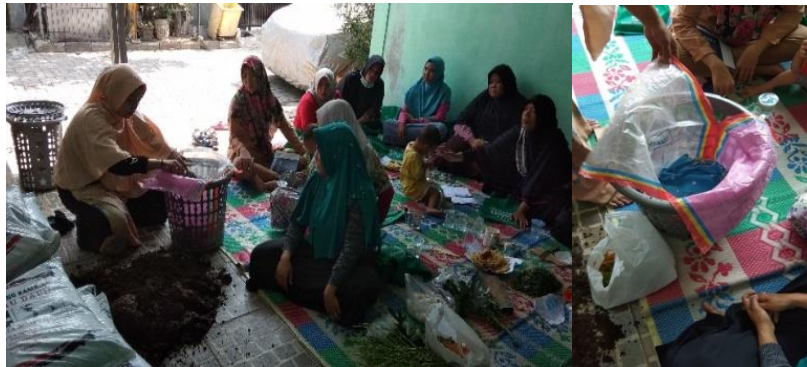
Gambar 5. Narasumber Mendemonstrasikan Kepada Para Peserta Cara Menyusun Keranjang Takakura

konsistensinya di masa depan. Karena pada akhirnya masyarakat akan berupaya menerapkan kepedulian lingkungan melalui serangkaian tindakan penyelamatan lingkungan (Budimansyah, 2016), seperti terlihat pada Gambar 5.