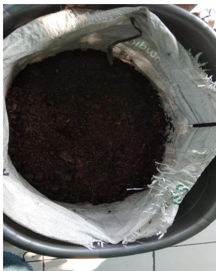
Gambar 9. Hasil Akhir Pengomposan Limbah Sayuran. Terlihat Butiran Kompos Semakin Halus

Adapun pemantauan dilakukan untuk melihat kemajuan seperti limbah organik yang digunakan, peletakkan keranjang, posisi bantalan penahan air, kadar air, dan suhu udara pada keranjang, keberadaan serangga, dan bau yang ditimbulkan dari dalam keranjang. Proses pengomposan yang berhasil ditandai dengan berubahnya limbah organik menjadi bahan yang menghitam dan tidak terasa lengket ketika dipegang dengan tangan kosong (Ridwan et al., 2014), seperti terlihat pada Gambar 9.