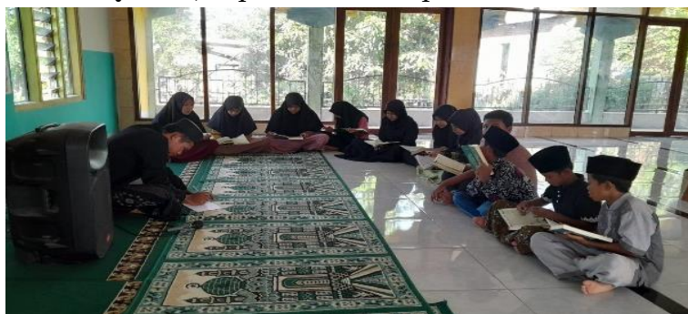
Gambar 2. Proses kegiatan membaca Al Qur'an dengan metode bayati

Pelaksanaan kegiatan pelatihan tahsin tilawah untuk remaja Masjid Nurul Iman Sumbawa dimulai dengan sebuah sesi pembukaan yang informatif, di mana konsep tahsin tilawah dan tujuan dari pelatihan ini secara rinci dijelaskan. Sebelas mitra remaja kemudian dikelompokkan menjadi satu tim, memastikan kerjasama dan interaksi positif di antara mereka. Sesi praktik tahsin tilawah dilakukan secara intensif dengan bimbingan langsung dari guru pembimbing yang memiliki keahlian dalam metode ini. Setiap remaja mendapat perhatian dan kesempatan yang sama untuk dibina dan melakukan percobaan pada setiap ayat yang dilatih. Ayat yang digunakan untuk latihan QS. Ali Imron: 121. Interaksi antara peserta dan guru pembimbing diharapkan dapat meningkatkan pemahaman mereka terhadap konsep tahsin tilawah dan meningkatkan keterampilan baca Al-Qur'an, seperti terlihat pada Gambar 2.