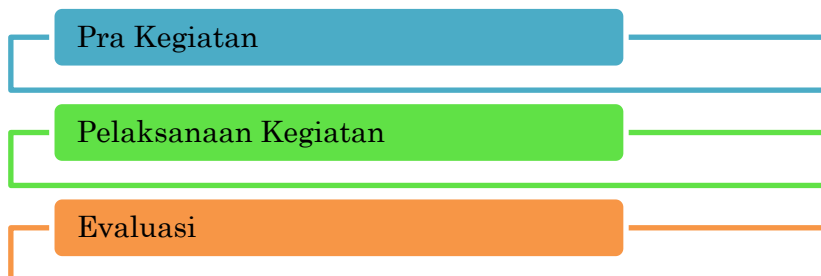
Gambar 1. Langkah-langkah pelaksanaan kegiatan

dan memperbaiki bacaan Al-Qur'an dengan meletakkan kaidah-kaidah cara membaca yang baik dan benar diantaranya makharijul huruf, sifat-sifat huruf, tajwid dan bacaan dengan tartil (Fitriani & Hayati, 2020). Adapun Langkah-langkah kegiatan dikategorikan menjadi tiga tahapan, seperti terlihat pada Gambar 1.