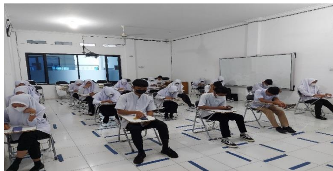
Gambar 3 Pelaksanaan ujian menggunakan aplikasi online

Setelah pelaksanaan pembuatan soal dan melakukan pengujian langsung kepada mahasiswa yang bertujuan untuk mengevaluasi pelatihan, baik dari sisi materi, kemudahan dalam penginputan soal serta saran dan kritik untuk tim. Hasil dari kuesioner evaluasi tersebut adalah sebagai berikut :