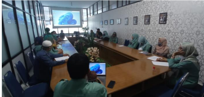
Gambar 2 Sosialisasi pengimputan soal ujian pada aplikasi google form