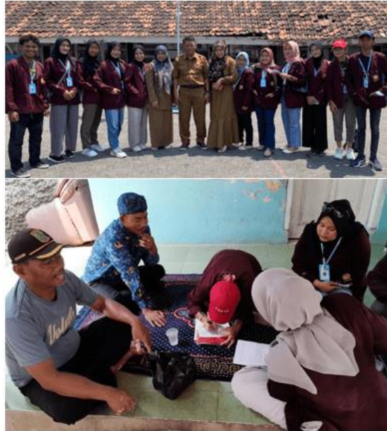
Gambar 4. Perijinan Pengambilan Data ke Lingkungan Masyarakat dan Sekolah

Setelah menyepakati program kegiatan selama PkM, tim melakukan pengambilan data ke masyarakat dengan berkunjung ke dusun dan sekolah – sekolah yang ada di sekitar desa seperti yang ditampilkan pada Gambar 4 dan Gambar 5.