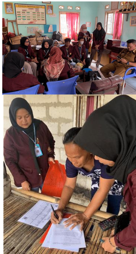
Gambar 5. Pengambilan Data ke Masyarakat dan Sekolah

Peningkatan pengetahuan masyarakat desa Pajaten Karawang terkait pemanfaatan dan pengelolaan sampah melalui “sosialisasi pendampingan pendirian bank sampah”