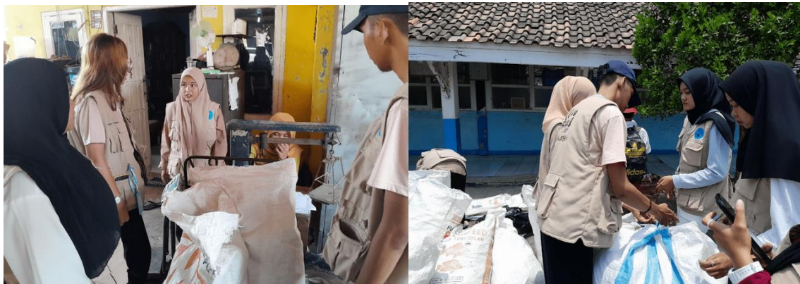
Gambar 9. Simulasi Bank Sampah Desa Pajaten Karawang