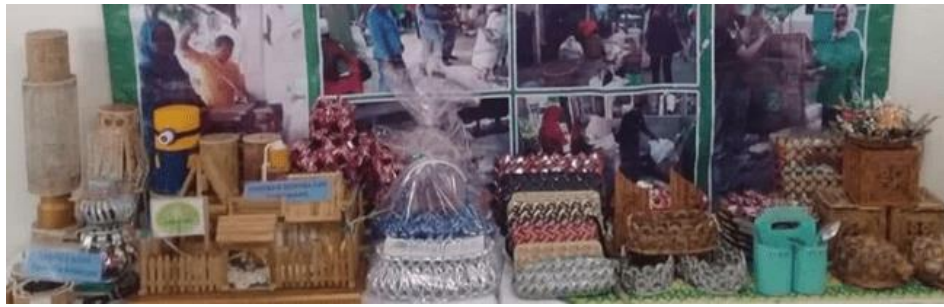
Gambar 8. Produk Daur Ulang Sampah