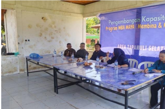
Gambar 1. Pembukaan acara kegiatan Pengembangan Kapasitas Usaha Program Mba Maya (Membina Dan Memberdaya) Kepada Masyarakat Kelompok Kreditur Mekar Dalam Pengembangan UMKM

Pada langkah pertama, yaitu dimulai dengan pembukaan acara kegiatan oleh ketua Tim PKM, kemudian sosialisasi mengenai pentingnya persyaratan mengajukan KUR, cara mengajukan KUR, serta kriteria penerima KUR, Tujuan KUR dan Penerima KUR Adapun syarat-syarat mengajukan kpr di Bank BRI adalah sebagai berikut: