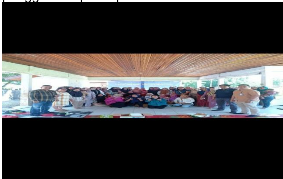
Gambar 4. Foto bersama dengan mitra

Dengan adanya metode PEKA (persuasif, edukatif, komunikatif dan akomodatif) terjadi suasana yang harmonis, dimana antara penyuluh dan masyarakat yang disuluh terjadi interaksi dan komunikasi yang lancar. Penyuluh juga menjelaskan dengan menggunakan sarana seperti LCD dengan penggunaan powerpoint.