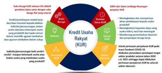
Gambar 2. Kriteria, tujuan dan kemudahan KUR

Langka kedua adalah memberikan materi terkait program “Mba maya”, di dalam program tersebut mencakup mengenai materi literasi keuangan dan digital. Literasi keuangan yaitu memanfaatkan pogram BRI dengan menjadi agen BRI Link agar dapat mengembangkan kapasitas usahanya. Tujuannya untuk mengajak nasabah-nasabah Permodalan Nasional madani Mekar menjadi agen BRI Link agar dapat mengembangkan kapasitas usahanya agar setiap transaksi pencairan nasabah menjadi keuntungan nasabah yang menjadi agen BRI Link.