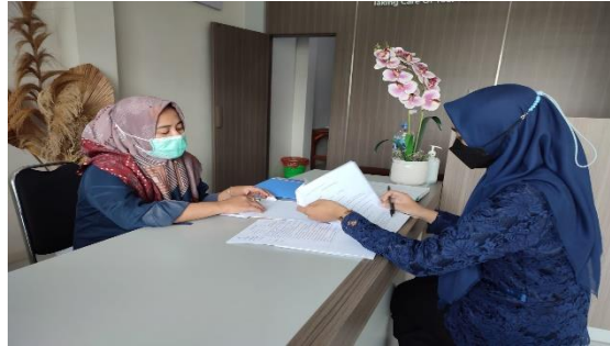
Gambar 1. Menentukan Jadwal Pelaksanaan Kegiatan