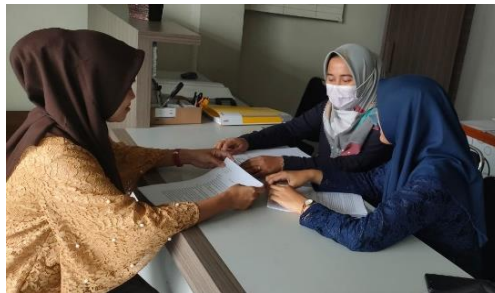
Gambar 2. Analisa Kebutuhan SOP

Tim Pengabdian Masyarakat dalam kegiatan ini memfokuskan pada bagian sistem pendaftaran pasien. Kegiatan ini dilaksanakan di salah satu klinik yang berada di wilayah Kabupaten Malang. Kegiatan ini dilakukan sebanyak 3 kali pertemuan yaitu pada tanggal 7, 14, dan 19 Desember 2023. Jumlah peserta yang terlibat dalam kegiatan ini 4 orang yang terdiri dari pimpinan klinik X dan petugas pendaftaran sebanyak 3 orang. Berikut merupakan dokumentasi kegiatan pengabdian masyarakat di klinik X.