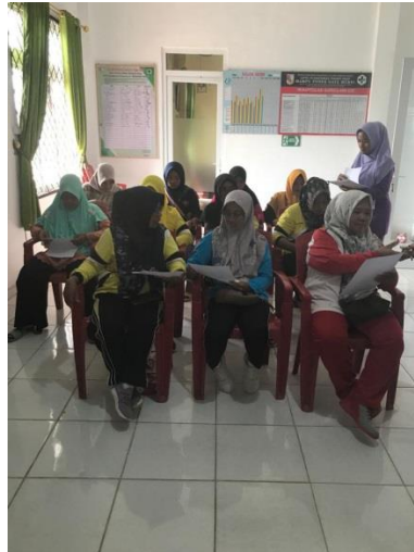
Gambar 4. Posttest mengenai kontrasepsi implant

Setelah kegiatan penyuluhan, terjadi peningkatan minat dan ketersediaan peserta untuk menggunakan alat kontrasepsi implant sebagai metode pengaturan keluarga. Hal ini tercermin dari jumlah peserta yang menyatakan niat untuk mengadopsi alat kontrasepsi ini setelah mendapatkan penjelasan yang mendalam mengenai manfaat dan prosedurnya. Dengan demikian, diharapkan para peserta dapat menjadi agen perubahan dengan menularkan ilmu pengetahuan tentang kontrasepsi implant ke lingkungan sekitar, sehingga informasi yang diperoleh dari penyuluhan dapat memberikan dampak positif yang lebih luas dalam masyarakat.