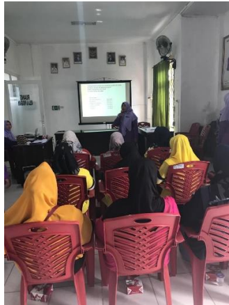
Gambar 1. Penyampaian materi mengenai kontrasepsi implant kepada peserta

Pelaksanaan kegiatan pengabdian dilakukan pada hari Kamis, 11 Januari 2024 pada pukul 08:30 - 12:30 WIB bertempat di UPTD puskesmas rawat inap Daya Murni, kecamatan Tumijajar, kabupaten Tulang Bawang Barat yang dihadiri oleh 11 orang wanita usia subur, dengan bentuk kegiatan yakni penyuluhan mengenai alat kontrasepsi KB implant dan pemasangan KB implant gratis. Dalam penyuluhan tersebut, audiens diberikan informasi yang komprehensif mengenai manfaat, cara penggunaan, serta efek samping dari alat kontrasepsi tersebut. Melalui presentasi yang interaktif serta diskusi dan tanya jawab, diharapkan terjadi peningkatan pengetahuan WUS mengenai kontrasepsi implant. Untuk mengetahui peningkatan pengetahuan peserta, tim pelaksana melakukan evaluasi dengan membagikan pertanyaan atau angket yang wajib diisi oleh peserta sebelum dan sesudah kegiatan. Evaluasi ini bertujuan untuk mengetahui pengaruh kegiatan penyuluhan terhadap perubahan pengetahuan peserta. Pertanyaan yang diberikan bersifat tertutup dengan pilihan jawaban. Peserta diminta untuk memberikan jawaban yang dianggap benar.