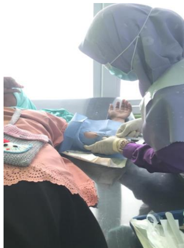
Gambar 5. Pemasangan implant kepada para peserta

Setelah kegiatan penyuluhan, terjadi peningkatan minat dan ketersediaan peserta untuk menggunakan alat kontrasepsi implant sebagai metode pengaturan keluarga. Hal ini tercermin dari jumlah peserta yang menyatakan niat untuk mengadopsi alat kontrasepsi ini setelah mendapatkan penjelasan yang mendalam mengenai manfaat dan prosedurnya. Dengan demikian, diharapkan para peserta dapat menjadi agen perubahan dengan menularkan ilmu pengetahuan tentang kontrasepsi implant ke lingkungan sekitar, sehingga informasi yang diperoleh dari penyuluhan dapat memberikan dampak positif yang lebih luas dalam masyarakat.