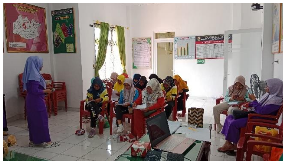
Gambar 3. Pretest mengenai kontrasepsi implant

Menurut penelitian Meilani sumber informasi yang didapat dari tenaga kesehatan karena informasi yang diterima dari tenaga kesehatan lebih dipahami dan dimengerti sebab jika merasa kurang jelas maka dapat bertanya langsung kepada petugas kesehatan. Kemudian, menurut Iriani kegiatan pengabdian masyarakat memiliki potensi untuk memberikan pengetahuan kepada wanita usia subur dan berkontribusi secara signifikan terhadap peningkatan partisipasi peserta dalam Program Keluarga Berencana dan Kesehatan Jiwa Puskesmas (KBMKJP), terutama dalam pemakaian alat kontrasepsi IUD dan implant.