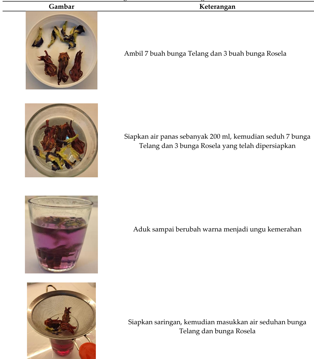
Tabel 3. Cara Pembuatan Minuman Herbal Pendamping Hipertensi Bunga Telang ( Clitoria ternatea ) dan Bunga Rosela ( Hibiscus sabdariffa L. )

Pengolahan bunga telang ( Clitoria Ternatea ) dan bunga rosela ( Hibiscus Sabdariffa L. ) sebagai minuman herbal pendamping pasien hipertensi di Posyandu Lansia Puskesmas Payangan