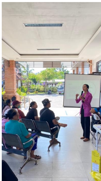
Gambar 1. Penyuluhan Materi Pengolahan Bunga Telang dan Bunga Rosela sebagai Pendamping Pasien Hipertensi

Saat pemberian penyuluhan kepada lansia, masih banyak lansia yang kurang paham terhadap dosis dan cara pemakaian minuman herbal sebagai pendamping pengobatan Hipertensi dengan obat konvensional. Beberapa lansia justru mengkonsumsi minuman herbal secara berlebihan dengan tujuan agar Hipertensi segera membaik. Namun, setelah pemberian materi tentang pengolahan minuman herbal kepada lansia akhirnya mereka memahami bahwa penggunaan minuman herbal secara berlebih juga dapat menimbulkan efek samping yang tidak diharapkan. Lansia dapat menggunakan dosis dan cara pakai minuman herbal bunga Telang dan bunga Rosela 2 kali sehari 200 ml setiap 12 jam. Evidence Base Medicine (EBM) bunga telang dan bunga rosella mengacu pada hasil penelitian sebelumnya yaitu penelitian yang dilakukan oleh Susanto dkk, 2024 dan Aprilia, 2023 dan penelitian dari Ariyani dan Sutanta, 2016. Pengolahan minuman herbal bunga telang dan bunga rosella mengacu pada penelitian Widowati dkk, 2022 dengan beberapa modifikasi pada komposisi bahan-bahan.