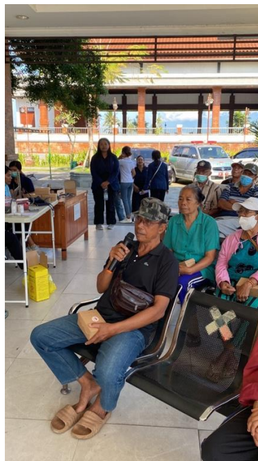
Gambar 2. Diskusi Narasumber dan Pasien Lansia di Puskesmas Payangan

Lansia juga berdiskusi tentang apakah obat konvensional bisa digantikan dengan obat herbal sebagai pengobatan Hipertensi. Ditekankan saat diskusi bahwa minuman herbal merupakan obat komplementer, yang berfungsi untuk pendukung, bukan pengganti obat konvensional. Sejalan dengan pengabdian masyarakat tentang edukasi bunga telang di Lombok Tengah, kelompok dampingan baru mengetahui khasiat bunga telang dalam mengatasi penyakit Hipertensi dan Diabetes Melitus serta dapat disajikan dalam bentuk seduhan. Sebelumnya kelompok dampingan hanya mengetahui bunga telang sebagai tanaman hias yang mempercantik pekarangan saja (Yulandasari dkk, 2023). Pemberian ekstrak bunga telang ( Clitoria ternatea ) menunjukkan aktivitas antihipertensi dengan menurunkan tekanan darah sistolik dan diastolik per oral pada mekanisme vaskular. Sehingga bunga telang dapat dijadikan sebagai alternatif pilihan sebagai pendukung dalam tatalaksana pada pasien Hipertensi (Rizkawati dkk., 2023). Bunga rosela juga efektif digunakan sebagai antihipertensi. Tanaman ini mengandung senyawa flavonoid, fenolik, asam organik, polisakarida, dan asam linoleate yang bertanggung jawab sebagai agen antihipertensi. Mekanisme antihipertensi dari bunga rosela yaitu penghambat ACE inhibitor, efek diuretik, penghambat aliran kalsium ke otot jantung, peningkatan sekresi NO ( Nitric Oxide ) serta modulator aksi aldosterone (Ni Pande Kadek Sinta Dewi and I Wayan Martadi Santika 2023).