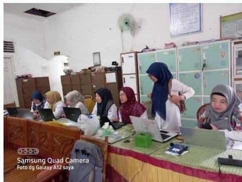
Gambar 3. Pelatihan Guru MI Al-Islah dalam membuat bahan ajar menggunakan canva

Berikut Dokumentasi kegiatan pemanfaatan aplikasi canva bagi Guru MI Al-Islah Palembang