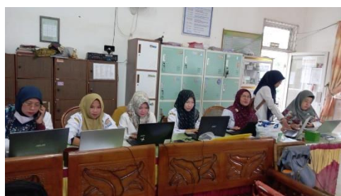
Gambar 4. Pembuatan Media Belajar Canva