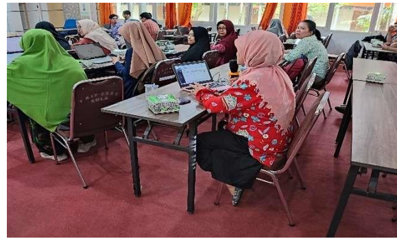
Pemaparan materi di Aula FKIP Untan