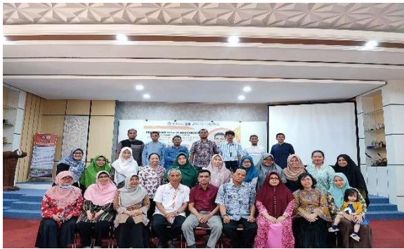
Pembukaan Kegiatan Bimbingan Teknis