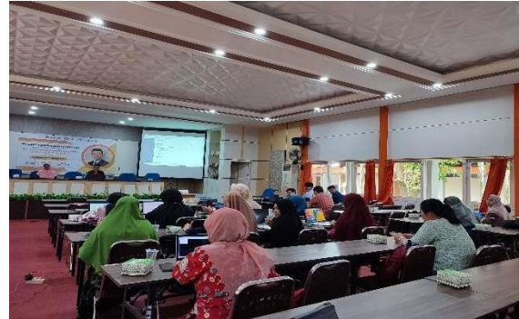
Sesi Akhir dan Penjadwalan Pertemuan Lanjutan