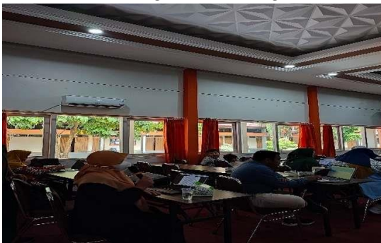
Diskusi dan Tanya Jawab Kegiatan E-SKP