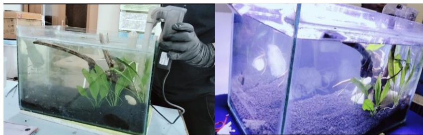
Gambar 5. Penataan desain Aquascape . Pemasangan filter air (kiri) dan penampakan Aquascape setelah diberi penerangan lampu dan siap diisi ikan (kanan).