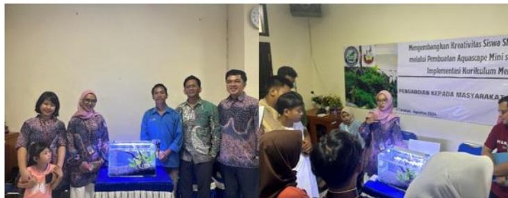
Gambar 6. Pameran aquascape yang telah dirangkai oleh tim bersama peserta pelatihan.

sisa-sisa pakan yang tidak termakan oleh ikan, juga dimungkinkan berasal dari organisme lain yang ada pada aquarium, termasuk bakteri, jamur, dan infusoria (Nasir & Khalil, 2016).