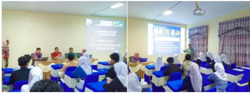
Gambar 3. Penyampaian materi oleh narasumber secara Direct Learning .

Kegiatan edukasi dilakukan melalui penyampaian materi kepada siswa secara tatap muka ( Direct Learning ) (Gambar 3).