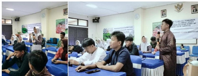
Gambar 4. Siswa antusias saat sesi diskusi dan tanya jawab terkait materi.

Direct Learning adalah narasumber menyampaikan informasi atau materi secara satu arah dengan banyak peserta didik. Pada akhir sesi peserta diberikan kesempatan untuk bertanya berkaitan hal yang belum dipahami (Espada dkk., 2020; Sairah dkk., 2021). Materi yang disampaikan meliputi pengertian dan konsep ekosistem akuatik sebagai materi pengantar sebelum siswa diberikan penjelasan terkait aquascape . Materi dilanjutkan dengan edukasi terkait pengertian aquascape , contoh desain-desain aquascape , dan bahan-bahan yang diperlukan. Siswa antusias dengan materi yang disampaikan tergambar dari banyaknya pertanyaan dari siswa dan siswa mampu menjawab pertanyaan dari narasumber saat sesi diskusi dan tanya jawab berlangsung (Gambar 4).