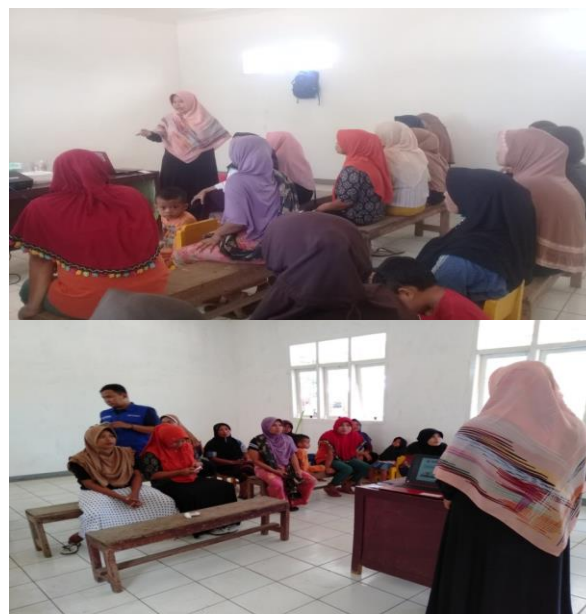
Gambar 3. Proses transfer ilmu pengetahuan melalui presentasi kegiatan pelatihan pembuatan minyak VCO di Desa Dangiing Kabupaten Lombok Utara

Tujuan dari kegiatan PKM ini adalah untuk memberika pengetahuan dan ketrampilan akan banyaknya manfaat dari pengolahan sumber daya alam seperti kelapa yang notabene di desa Dangiing ini menjadi komoditi yang potensial dan harga juga dapat dijangkau dengan banyaknya masyarakat yang menanam di kebun dan pekarangan rumah mereka yang banyak dilihat dan dijumpai tim PKM selama kegiatan survey dan observasi sebelum pelaksanaan pelatihan pembuatan minyak VCO ini. Jika dibandingkan dengan minyak kelapa biasa, atau sering disebut dengan minyak goreng (minyak kelapa kopra), minyak kelapa murni mempunyai kualitas yang lebih baik. Minyak kelapa kopra akan berwarna kuning kecoklatan, berbau tidak harum, dan mudah tengik, sehingga daya simpannya tidak bertahan lama (kurang dari dua bulan).