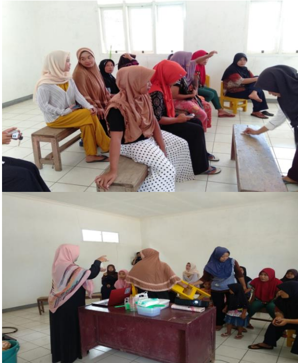
Gambar 4. Kegiatan sesi tanya jawab dan dilanjutkan praktek oleh tim PKM

Proses pembuatan minyak kelapa murni secara umum dapat dijelaskan sebagai berikut :