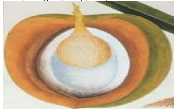
Gambar 2. Bagian – Bagian Kelapa

Dikenal memiliki banyak kandungan alami untuk tubuh dan ramah tanpa efek samping ketika pemakaian, Virgin Coconut Oil (VCO) seketika menjelma menjadi primadona baru di dunia kesehatan dan kecantikan di Indonesia bahkan di dunia. Maka, tak heran jika banyak negara mulai ikut memproduksi secara besar-besaran jenis minyak ini untuk mencukupi kebutuhan dan keinginan pasar.