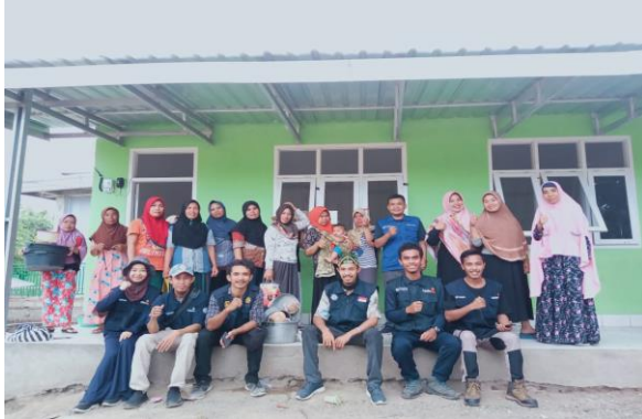
Gambar 5. Tim Pengabdian Kepada Masyarakat (PKM UMMAT)

bagi penderita diabetes dan mengatasi masalah kegemukan/obesitas. Oleh karena pemanfaatannya yang cukup luas, maka dengan pembuatan minyak kelapa murni ini dapat menjadi salah satu obat alternatif, selain itu juga dapat meningkatkan nilai ekonomi (anonim, 2009).