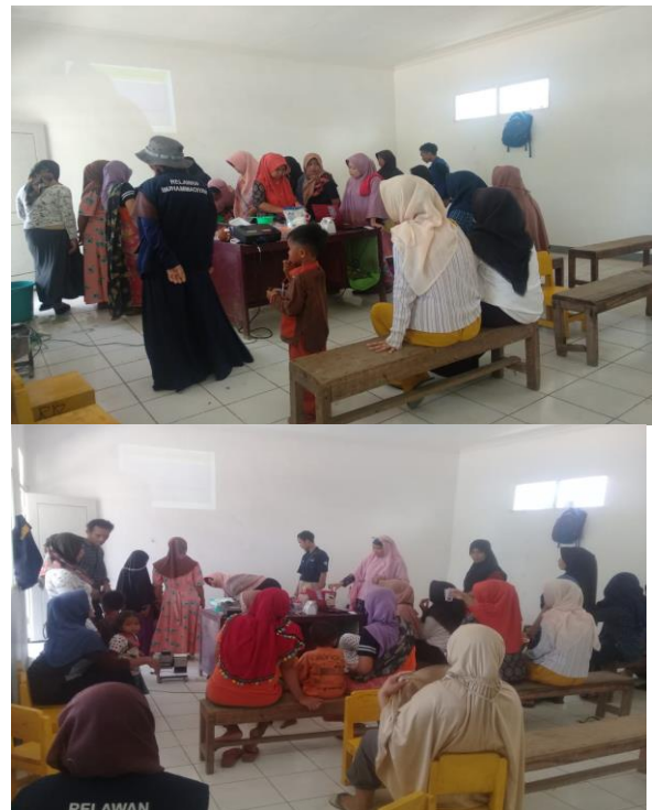
Gambar 5. Praktek pengolahan dan pembuatan minyak VCO oleh masyarakat

VCO sangat kaya dengan kandungan asam laurat ( laurat acid ) berkisar 5070%. Di dalam tubuh manusia asam laurat akan diubah menjadi monolaurin yang bersifat antivirus, antibakteri dan antiprotozoa serta asam lemak lain seperti asam kaprilat, yang didalam tubuh manusia diubah menjadi monokaprin yang bermanfaat untuk penyakit yang disebabkan oleh virus HSV2 dan HIV1 dan bakteri neisseria gonorrhoeae . Virgin Coconut Oil juga tidak membebani kerja pankreas serta dalam energi