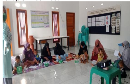
Gambar 3. Kegiatan Post test

Hasil post test menunjukkan bahwa 90% peserta mengalami peningkatan pengetahuan tentang kesehatan reproduksi. Orang tua sadar bahwa dengan informasi yang benar tentang kesehatan reproduksi maka anak akan terhindar dari perilaku yang tidak baik. Terlebih, jika mereka terpapar dengan dunia internet sehingga mereka bisa mendapat informasi yang belum tentu benar adanya dan justru menyimpang mengenai kesehatan reproduksi. Peran orangtua kemudian menjadi sangat penting untuk pendidikan dini mengenai kesehatan reproduksi yang harus mereka jaga sebelum mencari tau diluar.