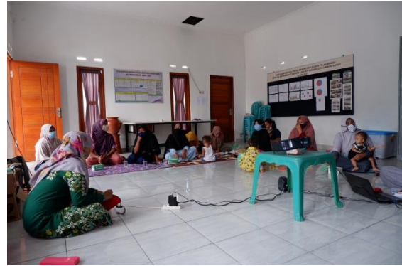
Gambar 1. Pre test

Hasil pre test menunjukkan bahwa pengetahuan warga tentang kesehatan reproduksi dalam kategori kurang yaitu sebesar 70% warga belum mengetahui cara membersihkan organ reproduksi yang benar. Orang tua merasa tabu untuk menjelaskan tentang kesehatan reproduksi kepada anaknya. Pertanyaan mengenai peran orangtua dalam memberi informasi tentang kesehatan reproduksi ke anaknya juga dalam katagori kurang yaitu 90% warga menganggap anak nya akan mengetahui tentang kesehatan repoduksi secara alami.