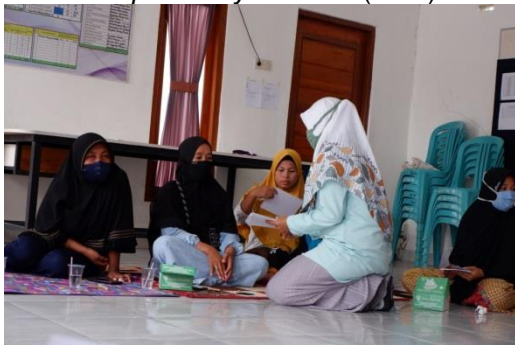
Gambar 3. Pembagian Modul Screen Dependency Disorder (SDD)