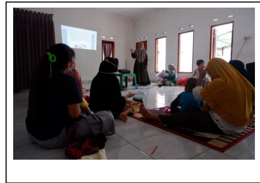
Gambar 4. Pemaparan Teori Dampak dan Pencegahan Screen Dependency Disorder (SDD)