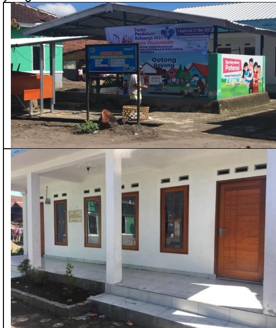
Gambar 2. Lokasi pengabdian masyarakat

Persiapan kegiatan pengabdian tanggal, lokasi pengabdian dan alat dan bahan yang dibutuhkan.