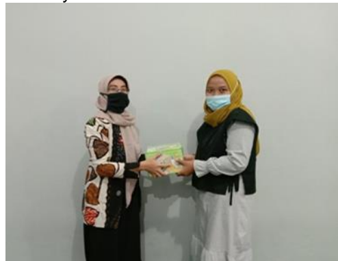
Gambar 1. Penyerahan gilingan pasta