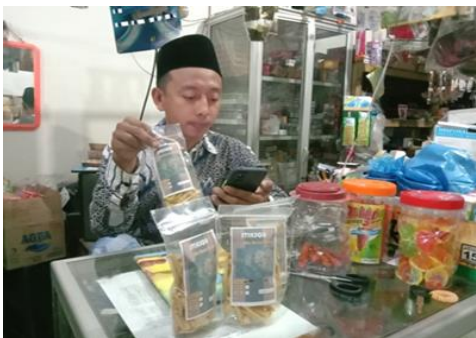
Gambar 3. Pemasaran Stiksqu dalam bentuk offline