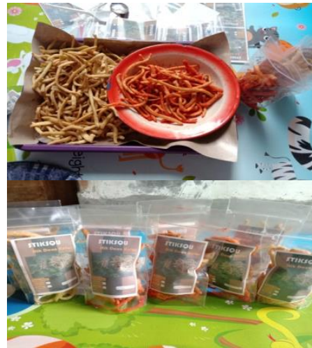
Gambar 5. Varian Produk Stiksqu

macam varian rasa. Pengabdian membekali pemilik usaha stiksqu dengan berbagai varian rasa agar lebih menarik minat pembeli untuk menikmati stiksqu, seperti rasa pedas pada stiksqu dibuat dari campuran bon cabe level original dan ditaburi oleh balado pedas yang menambah sensasi pedas dan gurih pada stik yang menambah minat pencinta stik. Penambahan variasi pada stik dikarenakan pelanggan sekarang banyak yang menyukai rasa pedas terutama pelanggan yang masih duduk di bangku sekolah.