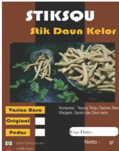
Gambar 6. Label Produk Stiksqu