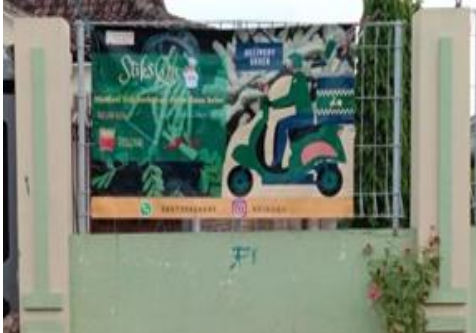
Gambar 2. Banner sebagai salah satu bentuk promosi