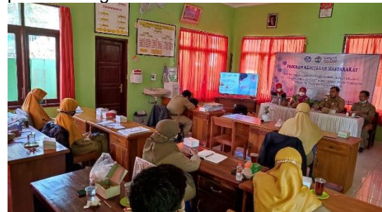
Gambar 3. Penyampaian materi SIST

Kegiatan ini dilakukan dengan diskusi dan tanya jawab secara interaktif. Guru banyak bertanya tentang penerapan SIST secara kontekstual yang dapat dilakukan secara mandiri. Selain itu guru juga bertanya tentang pemaknaan dari SIST dalam kaitannya dengan disabilitas ABK. Tim PKM memberikan pengetahuan tentang contoh-contoh real yang dapat dilakukan. Selain itu tim juga menjelaskan makna SIST untuk mendukung perkembangan ABK.