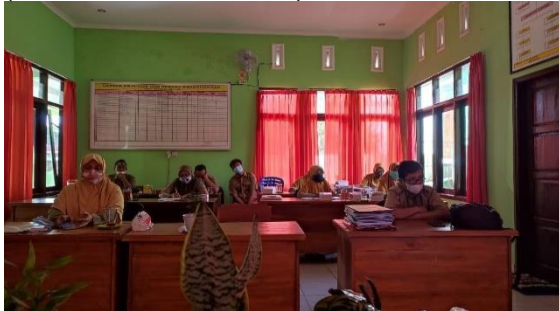
Gambar 4. Peserta pelatihan video pembelajaran

Materi kedua yang disampaikan adalah penyusunan materi ajar visual dengan media video. Guru diberikan pelatihan dan pengetahuan tentang setting ruang multimedia, produksi video, editing dan finishing media visual. Harapannya guru dapat membuat video pembelajaran bagi ABK yang dapat disampaikan secara daring pada ABK dirumah. Kompetensi guru dalam TIK dan penyusunan media interaktif sangat penting untuk dilakukan (Permatasari et al., 2019)