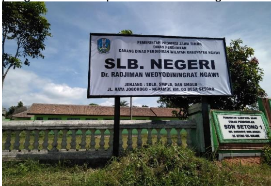
Gambar 1. SLBN Dr. Rdjiman Wedyodiningrat

Pembelajaran saat ini dilakukan secara daring melalui grup Whatapps dan seminggu dua kali dengan kunjungan ke rumah oleh guru. Guru sejumlah 11 orang belum mampu menjangkau kunjungan ke rumah secara optimal untuk ABK dari lima Kecamatan di Kabupaten Ngawi. Pembelajaran secara mandiri di rumah memerlukan dukungan dan peran serta orang tua dan keluarga (Fajrie & Masfiah, 2018). Namun, tidak semua keluarga memahami layanan untuk anak ABK, terutama untuk mengasah kemampuan motorik, sensorik, konsentrasi dan terapi. Keterampilan life skills ABK selama pembelajaran mandiri di rumah tidak begitu diperhatikan dan dilatihkan karena keterbatasan SDM guru dan keterbatasan pengetahuan dan perhatian dari orang tua.