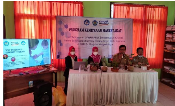
Gambar 2. Pembukaan dan sambutan

Tahap pertama yang dilakukan tim PKM adalah melakukan pembukaan acara. Pada kegiatan ini disampaikan perkenalan, maksud, tujuan, kegiatan dan luaran yang akan dihasilkan. Acara ini juga disambut oleh kepala SLBN Dr. Radjiman Wedyodiningrat dan Pengawas SLBN Jawa Timur. Adanya dukungan dan motivasi kelembagaan sangat penting untuk penguatan kompetensi guru.