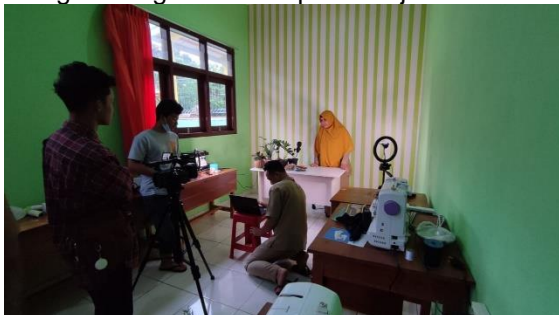
Gambar 5. Penyusunan ruang multimedia

Tahapan ketiga adalah menyusun ruang multimedia yang dapat digunakan oleh guru untuk produksi video pembelajaran. Ruang multimedia dilengkapi dengan audio dan video yang mendukung penyampaian materi yang guru lakukan (Pangga et al., 2020). Ruang ini diharapkan mampu mendorong guru untuk mengembangkan media pembelajaran.