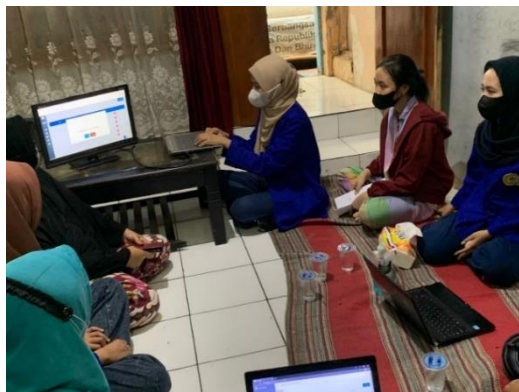
Gambar 1. Sosialisasi sistem pengelolaan bantuan berbasis web kepada ketua RT dan Ibu Dawis