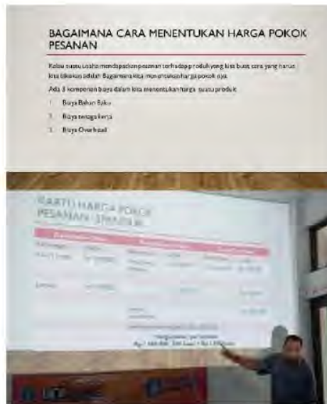
Gambar 5. Penentuan dan Pembuatan Kartu Harga Pokok

Materi selanjutnya mengenai cara menghitung modal, menentukan harga pokok, menentukan harga jual, dan membuat laporan laba rugi. Penyajian materi dilakukan melalui contoh agar memudahkan mitra dalam memahami materi.