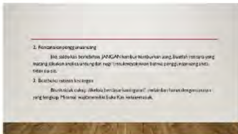
Gambar 4b. Perencanaan Penggunaan Uang dan Buku Catatan