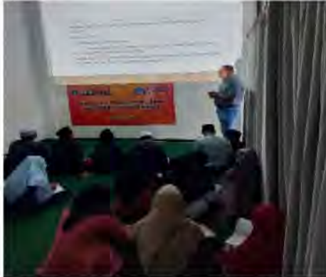
Gambar 3. Penyajian Materi Manajemen Keuangan

Kegiatan untuk mengatasi masalah mitra dilakukan dalam tiga tahap. Pertama, memberikan pelatihan mengenai manajemen keuangan. Kegiatan ini dilakukan dengan menggunakan metode ceramah berbantuan power point , tanya jawab, dan diskusi (Gambar 3).