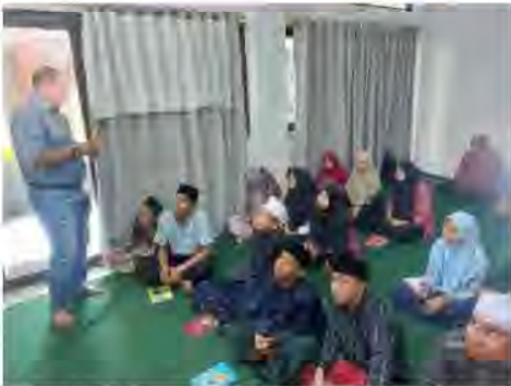
Gambar 6. Situasi Penyajian Materi

Kedua, pendampingan kegiatan praktik penentuan modal, penentuan harga pokok, dan penentuan harga jual. Para peserta pendampingan dibagi menjadi tiga kelompok. Masing-masing kelompok ditugasi mendata bahan baku dan takaran setiap bahan yang digunakan untuk membuat pizzuker. Data tersebut ditulis pada kartu harga pokok. Setelah itu, mereka menentukan harga masing-masing bahan baku dan menjumlahkannya. Selanjutnya, mereka menentukan biaya tenaga kerja dan biaya overhead . Hasil pendampingan berupa kartu harga pokok untuk pesanan pizza ditunjukkan pada Gambar 7.