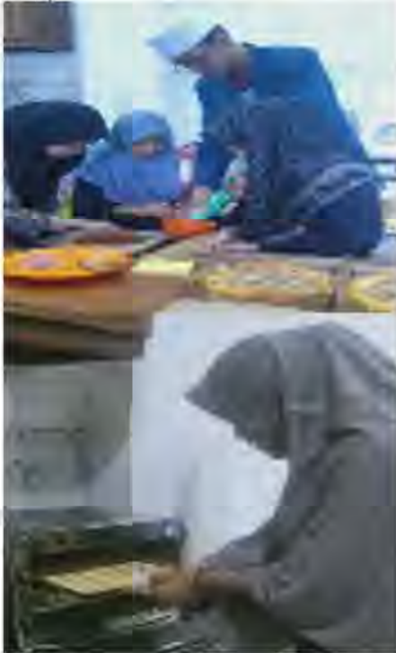
Gambar 1. Kegiatan Produksi Pizkuker

usaha pizkuker ini diharapkan sebagai bekal kecakapan hidup kelak ketika anak asuh hidup bermasyarakat (Yudiono, dkk., 2021). Proses produksi pizkuker dilakukan oleh anak asuh laki-laki dan perempuan yang mempunyai minat terhadap usaha ini (Gambar 1). Minat yang tinggi memberi kekuatan agar tidak menyerah ketika menemukan kegagalan (Vernia, dkk., 2018).