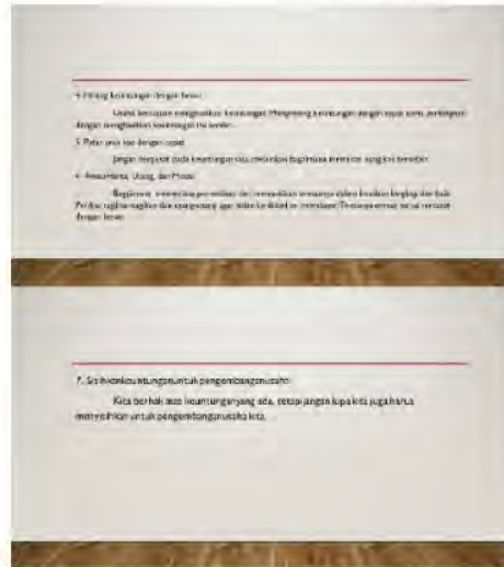
Gambar 4c. Penghitungan Keuntungan, Arus Kas, Pengawasan Harta, Utang, dan Modal, serta Penyisihan Keuntungan

Materi selanjutnya mengenai cara menghitung modal, menentukan harga pokok, menentukan harga jual, dan membuat laporan laba rugi. Penyajian materi dilakukan melalui contoh agar memudahkan mitra dalam memahami materi.