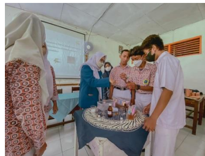
Gambar 2. Kegiatan Edukasi Tentang Ampas Teh dan Pembuatan Toner