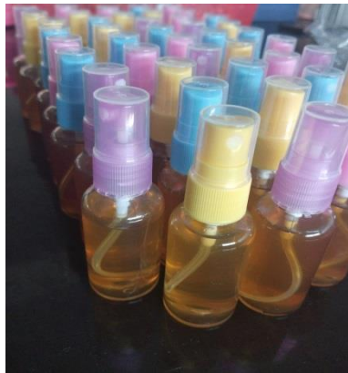
Gambar 1. Hasil Sediaan Toner yang Dibuat di Laboratorium Teknologi Farmasi D3 Farmasi

dan jumlah peserta yang akan diikuti dalam kegiatan. Langkah berikutnya yaitu dilakukan pembuatan toner oleh tim pengabdian yang bertempat di Laboratorium Teknologi Farmasi untuk keperluan Pengabdian kepada Masyarakat nantinya.