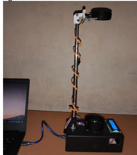
Gambar 2. Bentuk Akhir Media Alat Ukur Percepatan Gravitasi Berbasis Arduino Nano (Sumber: Dokumen Pribadi)

Penilaian media pembelajaran yang dikembangkan yaitu media alat ukur percepatan gravitasi berbasis Arduino Nano oleh validator ahli media secara umum dinyatakan sudah layak digunakan dengan revisi sesuai saran. Hasil perbaikan media pembelajaran yang dikembangkan dapat dilihat pada gambar dibawah ini.