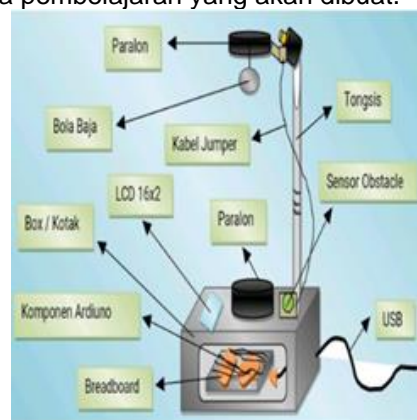
Gambar 1. Rancangan Media Alat Ukur Percepatan Gravitasi Berbasis Arduino Nano

Desain awal media pembelajaran menggunakan Microsoft word, tampilannya berupa rancangan gambar media pembelajaran yang dikembangkan. Rancangan media pembelajaran sudah dilengkapi komponen-komponen alat dan bahan beserta keterangannya. Berikut rancangan produk media pembelajaran yang akan dibuat.