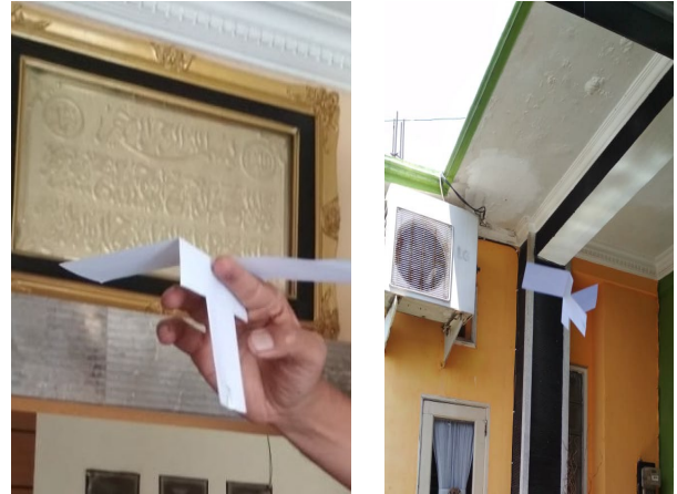
Gambar 6 : helikopter sederhana

hanya memiliki satu sayap, tetapi juga dapat berputar pada waktu jatuh. Arah putarnya ditentukan oleh bentuk sayap yang tidak simetris. Helikopter nyata tidak punya sayap, tapi baling-baling yang dapat berputar karena digerakkan oleh motor. Baling-baling tersebut memiliki bentuk tertentu sehingga pada saat berputar helikopter dapat naik.