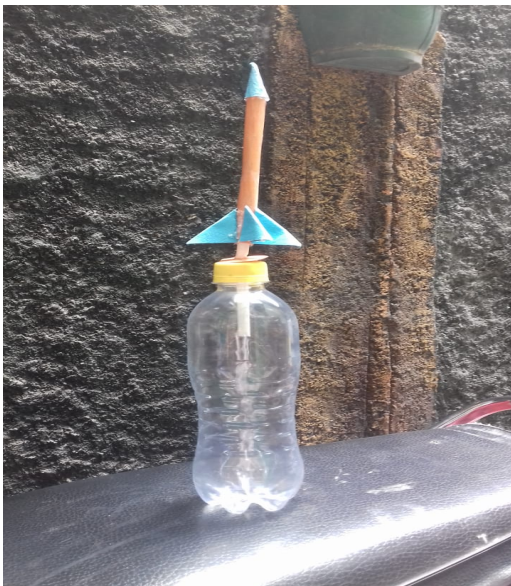
Gambar 5 : roket udara

(5) Roket tekanan udara, alat ini terbuat dari botol plastik, sedotan limun besar, sedotan limun kecil, plastisin, kertas karton dan paku. Alat ini dapat digunakan untuk menanamkan konsep tekanan udara pada siswa. Ketika botol ditekan, tekanan dalam botol naik dan udara keluar menuju sedotan yang terpasang pada tutup botol, akibatnya roket terdorong dan meluncur.