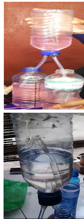
Gambar 3 : Pompa air tekanan udara

(3) Pompa air tekanan udara, alat ini terbuat dari botol plastik, air berwarna, dua wadah air transparan, dua potong selang berdiameter 3mm dan lumpur. Alat ini digunakan untuk memperlihatkan kepada siswa air yang berada di bawah dapat dinaikkan dengan bantuan tekanan udara.