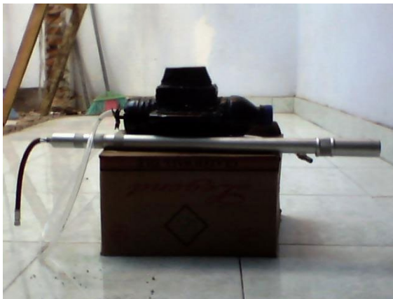
Gambar 1 : Alat Peraga Kapal Selam Sederhana

Kit fluida alternatif dari bahan-bahan lingkungan dan mudah didapatkan yang berhasil dibuat oleh tim terdiri dari: (1) alat peraga kapal selam sederhana. Kapal selam sederhana ini terbuat dari berbagai jenis botol plastik yang disatukan dengan lem sehingga berbentuk kapal selam. Bagian dalam dari kapal selam ini diberi balon untuk zat pengapung. Alat ini mampu memperlihatkan kepada peserta didik bagaimana sebuah kapal selam bisa mengapung, melayang dan tenggelam di air. Hal ini akan memberikan contoh nyata kepada peserta didik sehingga konsep terapung, tenggelam dan melayang dapat dipahami dengan baik.