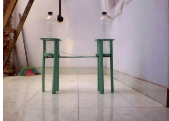
Gambar 2 : Alat Peraga Aliran Air

(2) alat peraga aliran air. Alat peraga ini terbuat dari botol plastik dan selang plastik yang menghubungkan dua botol. Alat ini mampu memperlihatkan kepada peserta didik bahwa aliran air akan terjadi bila ada perbedaan tinggi permukaan air. Hal ini akan memberikan contoh nyata tentang konsep aliran air,