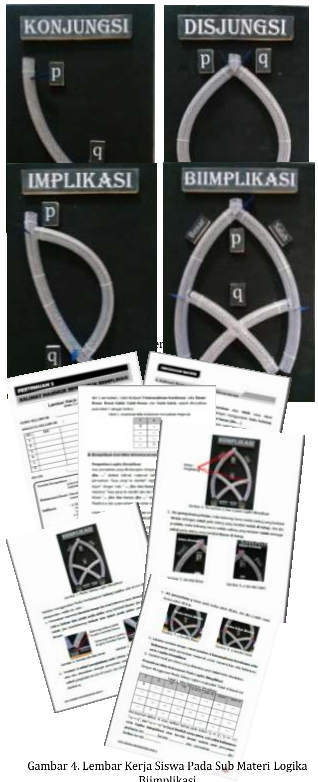
Gambar 4. Lembar Kerja Siswa Pada Sub Materi Logika Biimplikasi

Berikut adalah bentuk Akhir Pengembangan Media Pembelajaran Selang Logika dan Lembar Kerja Siswa (LKS).