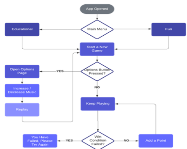
Gambar 1. Flowchart Desain Mobile Based Video Game

Sistem pengembangan mobile based video game untuk anak Down Syndrome dapat dilakukan dengan tahapan merancang flowchart, untuk memastikan rangkaian kerja dari program mobile based video game yang akan dikembangkan telah memenuhi tujuan yang diharapkan. Pengembang dapat menyusun flowchart seperti di bawah ini.