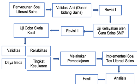
Gambar 1. Tahap Pelaksanaan Penelitian.

Prosedur penelitian dengan memberikan konsep kepada siswa mengenai materi asam, basa dan garam dilanjutkan dengan melakukan evaluasi dengan soal tes literasi sains. Analisis data dihitung dengan menggunakan menghitung persentase ketercapaian literasi sains. Tahapan penelitian dapat dilihat pada Gambar 1.