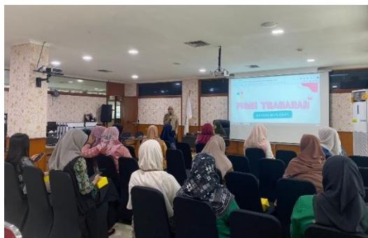
Gambar 1. Majelis Taklim Pegawai Perempuan