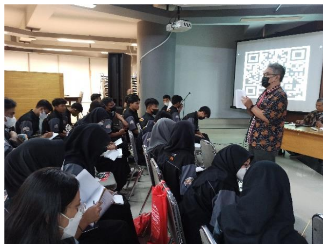
Gambar 7 Presentasi Hasil Prototype