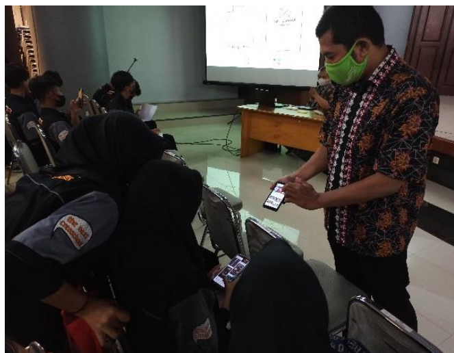
Gambar 6 Keaktifan Peserta Saat Kegiatan Workshop