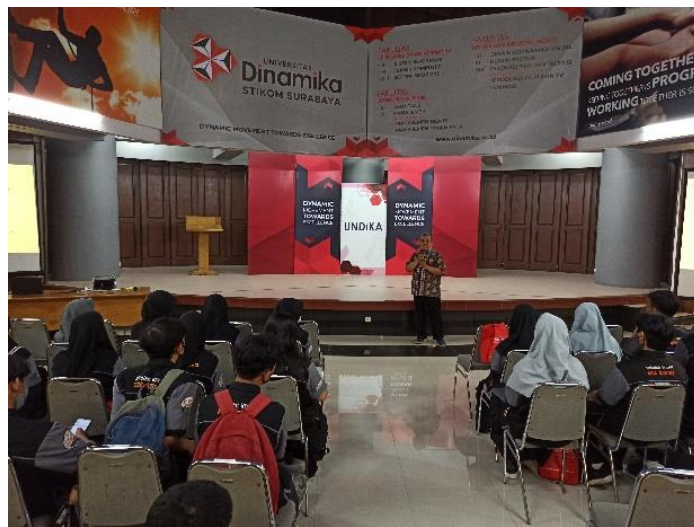
Gambar 3 Pemaparan Materi Oleh Trainer

Berikut ini adalah foto-foto kegiatan Pengabdian Pada Masyarakat Siswa SMK IPIEMS Surabaya di ruang Laksda Mardiono Universitas Dinamika (Gambar 2-6) :