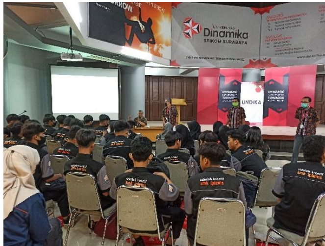
Gambar 5 Diskusi Para Peserta Dengan Trainer