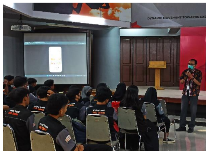
Gambar 4 Pemaparan Materi Oleh Trainer