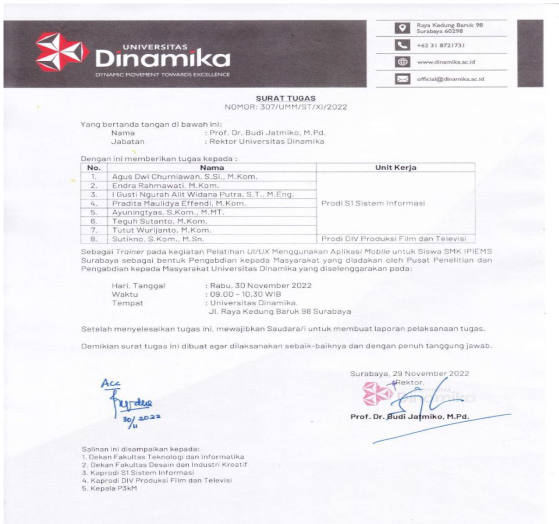
Gambar 2 Surat Tugas Trainer

Universitas Dinamika adalah kampus swasta yang terletak di kota Surabaya. Di mata masyarakat Universitas Dinamika dikenal juga sebagai kampus IT (Information Technology). Program studi yang paling diminati adalah S1 Sistem Informasi (SI). Dipilihnya program studi S1 SI karena memiliki dosen-dosen yang benar-benar ahli dalam bidang sistem informasi dan komputer. Perancangan UI/UX merupakan salah satu matakuliah yang diajarkan pada program studi S1 Sistem Informasi karena tim pengabdian masyarakat menugaskan beberapa dosen terpilih sebagai trainer sesuai dengan surat tugas pada gambar berikut.