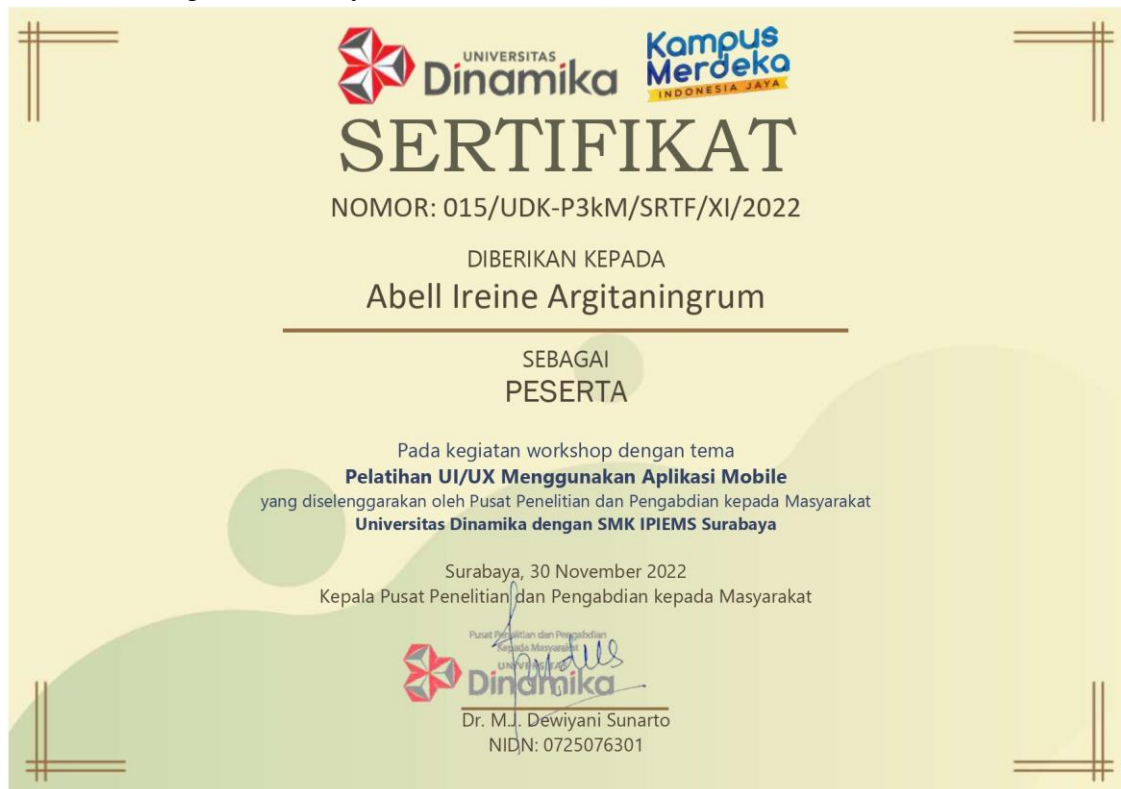
Gambar 9 Contoh E-Sertifikat Peserta

Setelah kegiatan workshop akan berakhir para siswa diminta untuk mengisi survey evaluasi yang hasilnya dapat dilihat pada Tabel 4 berikut. Selain itu sebagai bentuk penghargaan para peserta mendapatkan e-sertifikat yang diberikan oleh bagian Pusat Penelitian dan Pengabdian Masyarakat Universitas Dinamika.