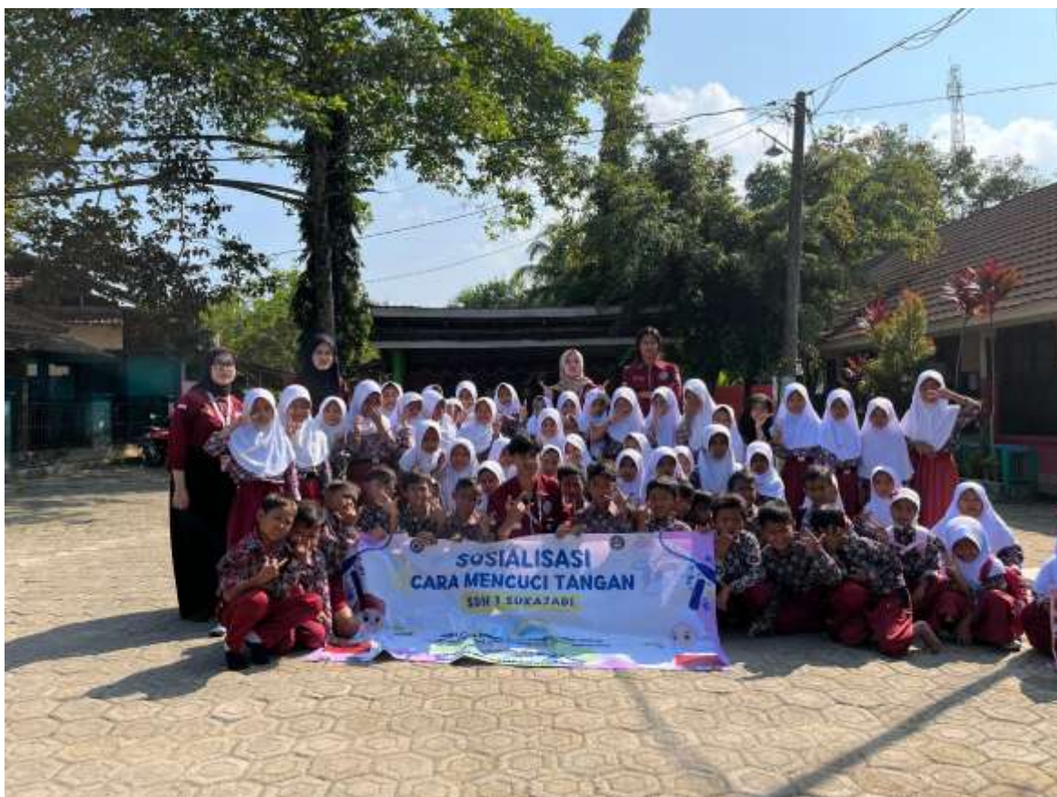
Gambar 4. Foto bersama setelah sosialisasi

harapannya dengan kegiatan ini dapat memberikan pengalaman yang berharga tentang pentingnya menjaga kesehatan dimulai dari diri sendiri menanamkan rasa disiplin terhadap kesehatan karena kesehatan itu sangat berharga di antara yang lain, akhirnya kegiatan yang berlangsung setengah hari ini memberikan kesan yang baik bagi siswa-dan siswi SDN 1 Sukajadi berakhirnya kegiatan sosialisasi ini tentunya memberikan kenangan manis dan akan didukemntasi sebagai tanda bahwa kita peduli dengan hidup sehat (Aini & Sriasih, 2020).