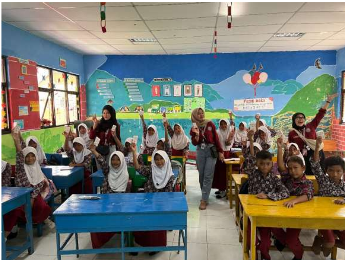
Gambar 2. Dokumentasi kegiatan sosialisasi

target sosialisasi disini adalah kelas 1,2 dan 3 karena masih belum faham akan pentingnya mencuci tangan sebagai upaya mencegah diare di musim penghujan kegiatan ini sangat disambut antusias oleh siswa-siswi apalagi kakak-kakak yang memandu sosialisasi ini sangat ramah dan baik hati siswa yang tadinya malas mencuci tangan menjadi rajin mencuci tangan sebelum dan sesudah makan karena pada dasarnya mencegah lebih baik dari pada mengobati (Abil Rudi, 2020).