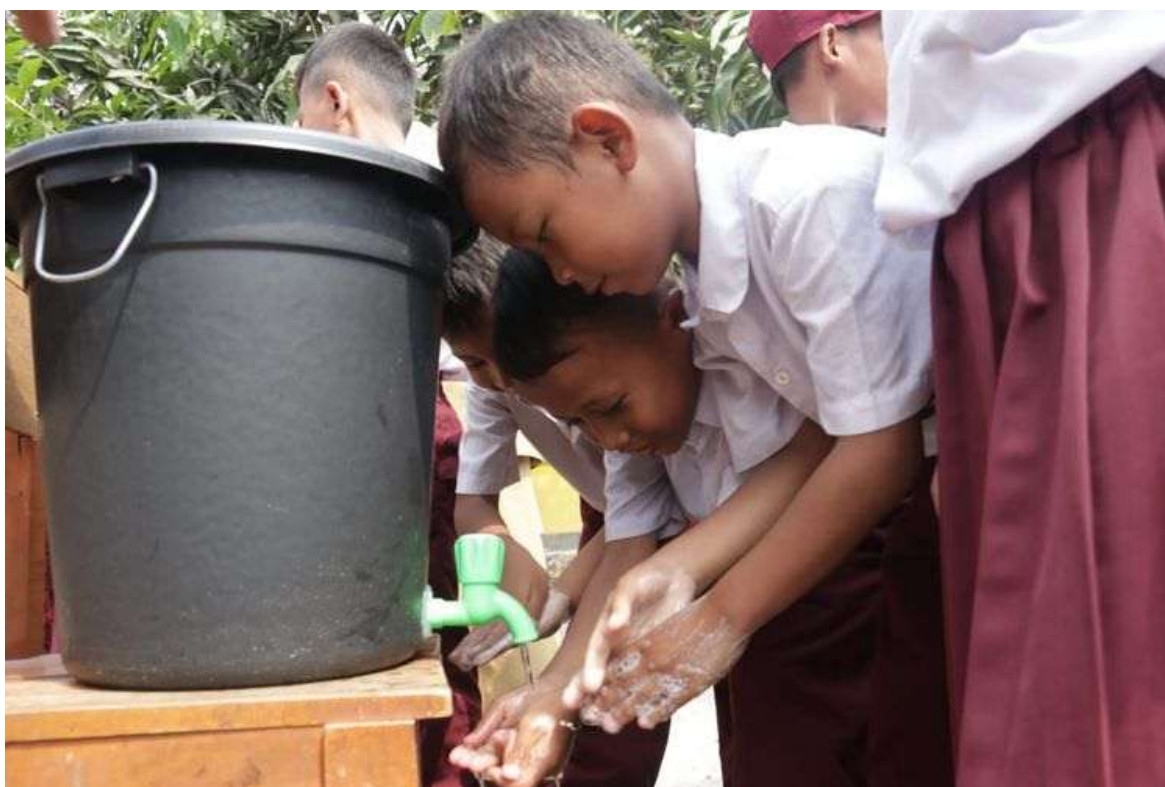
Gambar 3. Praktek mencuci tangan yang baik dan benar

Ditahap keempat adalah tahap praktik mencuci tangan dengan baik dan benar menggunakan sabun boleh sabun batangan atau sabu cair cucilah tangan sebelum makan dibawah air mengalir ini dilakukan agar kuman yang menempel di tangan bisa dihilangkan dengan sabun dan dibawah air mengalir tujuannya supaya tangan selalu terjaga kebersihannya mengkonsumsi apapun tidak khawatir karena seribu jenis penyakit itu berasal dari tangan, tangan yang menghantarkan makanan kedalam mulut dengan kegiatan ini siswa dan siswi mendapatkan pelajaran yang berharga agar kebiasaan mencuci tangan dengan sabun dapat dilakukan setiap hari dan menjadi rutinitas yang baik (Rahmawati & Moh Badrus Solichin, 2021).