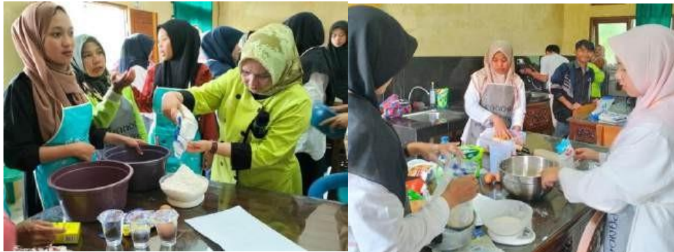
Gambar 3. Peserta Melakukan Praktik Pembuatan Produk

wawasan dan pengetahuan guru pamong serta peserta di SKB 1 Tanah Datar, yang jumlahnya sekitar 50 orang, termasuk anak muda dan mereka yang sudah berkeluarga.