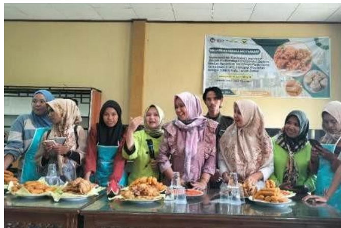
Gambar 4. Peserta Dan Narasumber Bersama Melakukan Evaluasi Produk

Dalam pelatihan ini, narasumber akan memulai dengan menjelaskan teori pembuatan menu, meliputi alat dan bahan yang diperlukan, langkah-langkah pembuatan, serta tips dan trik penting untuk memastikan hasil yang optimal. Setelah penjelasan teori, narasumber akan langsung mempraktikkan pembuatan menu sambil membagi peserta ke dalam beberapa kelompok. Setiap kelompok akan bekerja sama dalam memproduksi menu sesuai dengan panduan yang telah diberikan. Selama praktik, narasumber akan mengawasi dan memberikan bimbingan, memastikan bahwa teknik yang diajarkan diterapkan dengan benar dan proses pembuatan dilakukan dengan tepat.