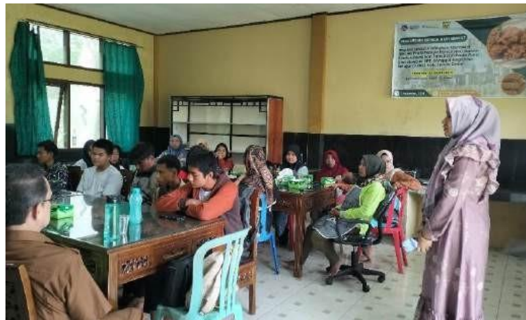
Gambar 2. Pelatihan Tahap 1 penyampaian informasi tentang P5

Pelatihan ini bertujuan untuk meningkatkan pengetahuan dan kompetensi guru pamong serta peserta didik dengan melibatkan narasumber yang ahli di bidang kompetensi kurikulum melalui teori. Metode yang digunakan dalam pelatihan meliputi tiga pendekatan utama. Pertama, Transfer of Knowledge , yang berfokus pada penyampaian pemahaman mendalam tentang kurikulum kesetaraan, pemberdayaan, dan keterampilan berbasis Profil Pelajar Pancasila kepada peserta didik dan guru pamong. Kedua, Sustainability , yang bertujuan meningkatkan sumber daya manusia secara berkelanjutan melalui pelatihan dan pendampingan terkait pemanfaatan sumber daya lokal, seperti pelatihan tata boga yang sesuai dengan kearifan lokal masyarakat setempat. Ketiga, Income Generation , yang mengupayakan agar pelatihan memberikan dampak nyata dengan memungkinkan guru pamong dan peserta didik memanfaatkan sumber daya alam di sekitar mereka, serta membuka lapangan usaha sendiri. Dengan pendekatan ini, diharapkan peserta didik tidak hanya memperoleh ijazah kesetaraan tetapi juga keterampilan berwirausaha yang dapat menjadi sumber pendapatan tambahan, mendukung kesejahteraan ekonomi mereka.