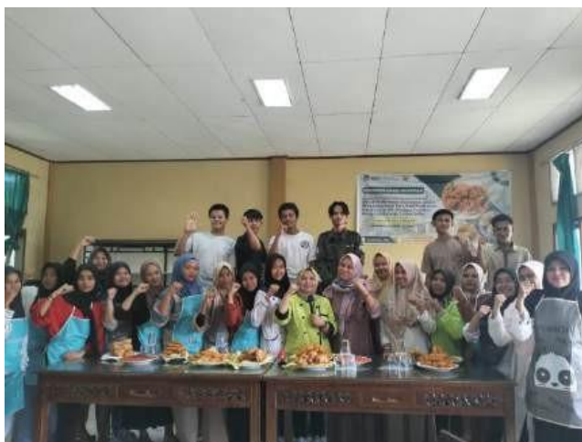
Gambar 5. Foto Peserta Dan Produk Masing-Masing

hasil dari pelatihan ini dapat menjadi dasar untuk membuka lapangan usaha baru dan menciptakan peluang kerja, sehingga peserta dapat memanfaatkan keterampilan yang diperoleh untuk keberhasilan di masa depan.