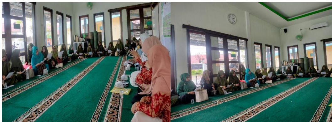
Gambar 1.1 : Pengisian Kuisioner

tentang vaksin imunisasi JE tapi masih banyak dari peserta yang tidak mengetahui tentang vaksin JE dan pencegahan penyakit JE. Hal ini menunjukkan bahwa tingkat pemahaman peserta tentang vaksin JE masih kurang. Setelah pengisian kuisioner dilanjutkan dengan penjelasan imunisasi vaksin JE.