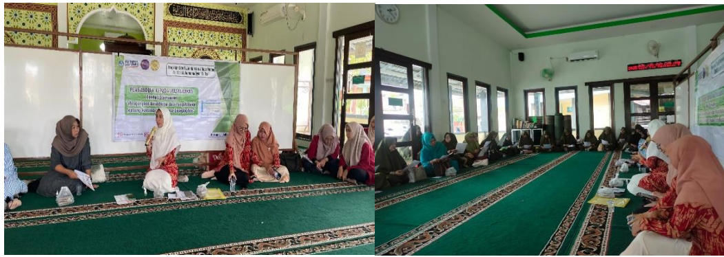
Gambar 1.2 : Penyampaian Materi

Langkah terakhir dalam pengabdian ini dilakukan pengisian kuisioner, dilaksanakan untuk mengetahui pengetahuan dan kesadaran Masyarakat tentang vaksin JE untuk mencegah penyakitnya.