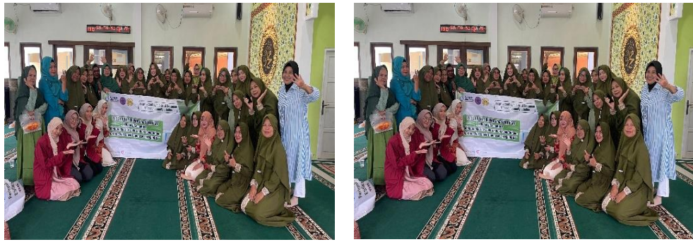
Gambar 1.4 Pelaksanaan Pengabdian Masyarakat