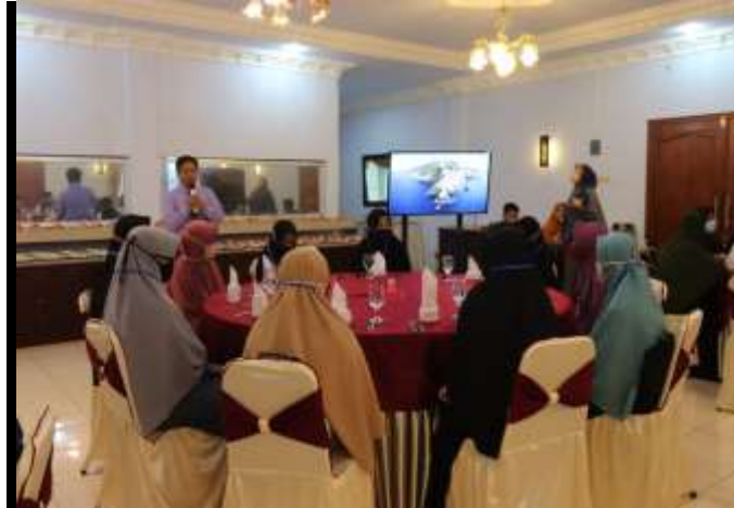
Figure 1: Table Manner Activity