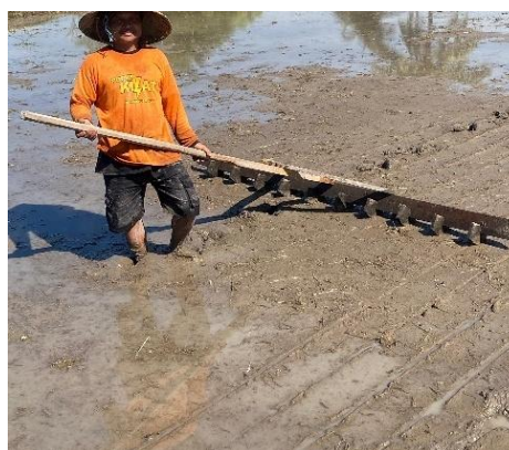
Gambar 8. Proses Pembuatan Jarak Tanam

padi dalam barisan dan memperlebar jarak antar barisan. Tujuannya untuk menambah populasi tanaman per satuan luas dan menciptakan ruang kosong memanjang yang memudahkan pemeliharaan padi [17]. Jarak tanam yang digunakan adalah 20 cm x 20 cm dengan satu barisan kosong setiap lima barisan tanaman (5:1). Pengaturan jarak tanam dilakukan menggunakan garu kayu (Gambar 10) yang memiliki bilah-bilah di bagian bawahnya untuk membentuk garis sejajar pada tanah berlumpur sebagai pedoman penanaman. Sistem jajar legowo terbukti meningkatkan efisiensi penyerapan cahaya matahari dan mempermudah proses perawatan seperti pemupukan, penyemprotan, serta penyiangan. Selain itu, sistem ini mampu meningkatkan jumlah anakan produktif dan menurunkan kelembapan di antara tanaman, sehingga mengurangi risiko serangan penyakit [18]. Metode ini telah menjadi standar dalam budidaya padi benih bersertifikat.