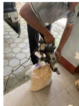
Gambar 25. Proses Penyegelan

Proses penyegelan (Gambar 26) dilakukan menggunakan mesin jahit karung portable HighSpeed YAOHAN N602H , yang memungkinkan petugas menyegel kemasan secara efisien dan seragam. Penyegelan yang baik penting untuk melindungi benih dari kelembaban udara dan serangan hama gudang selama penyimpanan [50]. Setiap kemasan benih yang telah dijahit dilengkapi label berisi informasi seperti varietas benih, nomor lot, tanggal panen, dan kadar air. Label ini berfungsi sebagai identitas produk sekaligus bukti keaslian dan mutu benih yang diproduksi oleh BBIP Narmada.