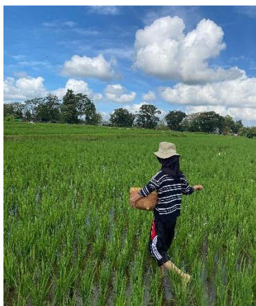
Gambar 13. Proses Pemupukan

Pemupukan (Gambar 14) dilakukan tiga kali dengan menggunakan pupuk Urea (PT. Pupuk Kujang, Karawang, Jawa Barat), SP-36 (PT. Petrokimia Gresik, Gresik, Jawa Timur), dan NPK (PT. Pupuk Kalimantan Timur (PKT), Bontang, Kalimantan timur) dalam perbandingan 1:1:1. Pemupukan pertama dilakukan pada umur 10–15 hari setelah pindah tanam (HSPT), pemupukan kedua pada umur 21–30 HSPT, dan pemupukan ketiga pada umur 45–50 HSPT. Setiap hektar lahan diberikan pupuk sebanyak 300 kg atau enam karung berukuran 50 kg. Pupuk ditaburkan secara merata di sekitar tanaman agar penyerapan unsur hara oleh akar berlangsung optimal.