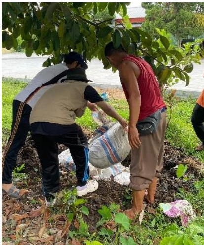
Gambar 4. Proses penguburan benih

kelembapan tetap stabil serta menghindari paparan langsung terhadap sinar matahari dan angin. Media lembap ini menciptakan lingkungan kondusif bagi pertumbuhan akar dan tunas benih secara merata. Selama proses tersebut, dilakukan pengawasan rutin untuk memastikan benih tidak kekurangan oksigen dan tidak rusak akibat kelembapan berlebih. Setelah muncul tunas dengan panjang sekitar \pm 1 cm, benih dinyatakan siap untuk ditaburkan pada bedengan persemaian.