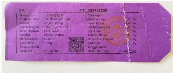
Gambar 22. Label Ungu