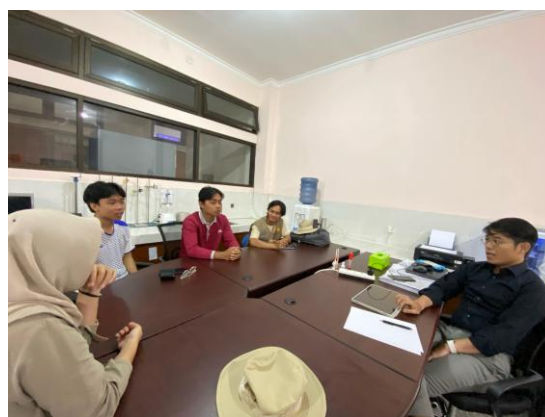
Gambar 27. Mentoring Bersama DPL

Berdasarkan hasil Kegiatan PKL MBKM di UPTD Balai Benih Induk Pertanian (BBIP) UPB Peninjauan Narmada, dapat disimpulkan bahwa kegiatan PKL MBKM ini berperan penting dalam meningkatkan kompetensi mahasiswa di bidang pengelolaan benih padi. Melalui keterlibatan langsung pada seluruh tahap produksi, mahasiswa memperoleh pemahaman tentang penerapan standar mutu benih, pemanfaatan teknologi pertanian, serta pentingnya inovasi dan pengembangan infrastruktur untuk mendukung produksi berkelanjutan. Selain itu, kegiatan ini mengembangkan keterampilan teknis, kemampuan komunikasi, dan kerja sama tim, sekaligus memperkuat keterkaitan antara teori dan praktik dalam pengembangan sektor pertanian di Nusa Tenggara Barat.