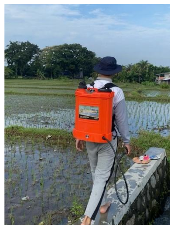
Gambar 11. Penyemprotan Insektisida

Selain itu, penyemprotan zat pengatur tumbuh (ZPT) dilakukan pada umur 7–10 hari setelah pindah tanam (HSPT) dan diulang pada umur 25–30 HSPT (Gambar 13). Pemberian ZPT bertujuan merangsang pertumbuhan anakan dan meningkatkan potensi pembentukan malai [29].