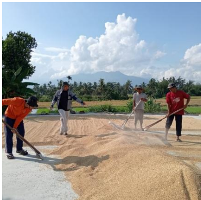
Gambar 15. Proses Penjemuran Benih

menurunkan kadar air gabah hasil panen hingga mencapai kadar ideal benih padi, yaitu 11–12% [30]. Proses pengeringan alami biasanya berlangsung 2–3 hari, tergantung kondisi cuaca.