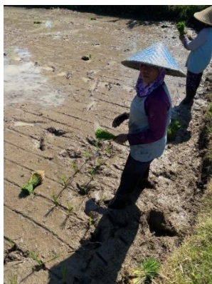
Gambar 9. Proses Penanaman

Proses penanaman dilakukan secara manual oleh tenaga kerja lapangan yang berpengalaman. Bibit hasil persemaian dicabut dengan hati-hati (Gambar 8) untuk mencegah kerusakan akar, kemudian diikat dalam satuan kecil agar mudah dibawa ke lahan tanam. Setiap lubang tanam diisi dua hingga tiga bibit untuk menjamin keberhasilan tumbuh per rumpun dan mencegah kompetisi antar tanaman akibat jumlah bibit yang berlebihan. Jumlah bibit per lubang tanam berpengaruh terhadap pertumbuhan dan hasil tanaman padi ( Oryza sativa L. ) pada metode The System of Rice Intensification , karena berkaitan langsung dengan tingkat kompetisi antar tanaman dalam satu rumpun [22]. Bibit ditanam secara tegak (Gambar 10) dan tidak terlalu dalam agar terhindar dari pembusukan serta memungkinkan akar tumbuh optimal. Penanaman dilakukan secara serempak di seluruh petak sawah untuk menjaga keseragaman umur tanaman.