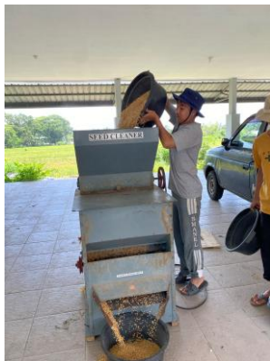
Gambar 17. Proses Sortasi Benih Padi Menggunakan Mesin Seed Cleaner

Sebelum dikemas, benih padi terlebih dahulu melalui proses pembersihan dan sortasi untuk memastikan kualitasnya. Proses ini bertujuan menghilangkan kotoran, benda asing, gabah hampa, serta benih yang rusak [39], [40]. Pembersihan dilakukan menggunakan mesin seed cleaner yang berfungsi menyeleksi benih berdasarkan berat jenis dan ukuran. cleaner yang digunakan di BBIP Mesin seed masih bersifat manual-mekanik, namun tetap efektif dalam memisahkan benih berkualitas (Gambar 18).