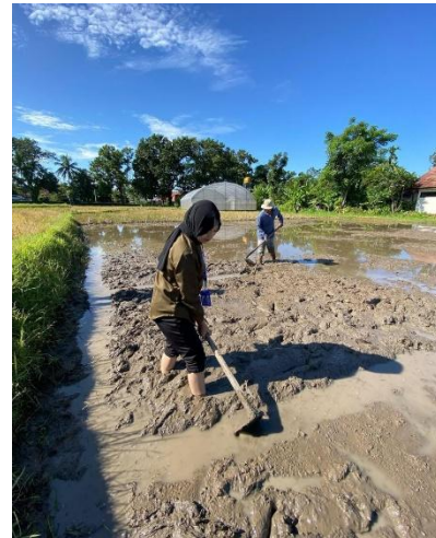
Gambar 5. Proses pembuatan bedengan

Tahap berikutnya adalah pembuatan bedengan (Gambar 6) dan persemaian sebagai bagian penting dari proses budidaya padi unggul bersertifikat. Bedengan dibuat pada lahan yang telah disanitasi menggunakan herbisida (Gambar 2) dan diolah dengan hand tractor agar tanah menjadi gembur dan rata (Gambar 3). Bedengan memiliki tinggi sekitar 10–15 cm dan lebar \pm 1 meter, sedangkan panjangnya disesuaikan dengan kondisi lahan. Jarak antar bedengan dibuat cukup lebar untuk memudahkan proses perawatan dan pengairan. Tanah pada bedengan diratakan dan dibersihkan dari gulma maupun sisa tanaman sebelumnya agar media tanam benar-benar siap digunakan.