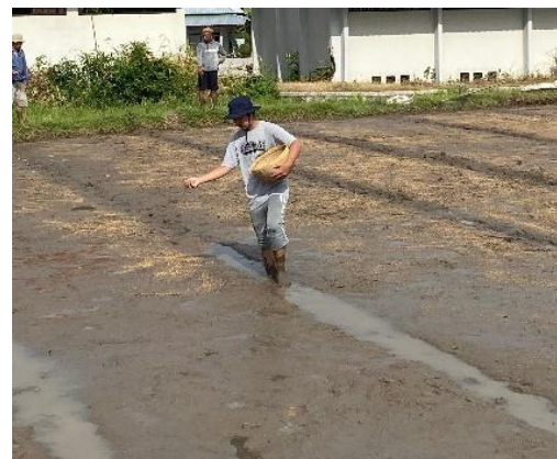
Gambar 6. Proses Penaburan Benih

Setelah bedengan selesai disiapkan, pada hari berikutnya dilakukan penaburan benih (Gambar 7) secara merata di atas permukaan bedengan. Penaburan dilakukan dengan hati-hati agar kepadatan tanaman tidak terlalu rapat, yang dapat memicu serangan penyakit dan menurunkan mutu benih. Selama masa persemaian, dilakukan pemantauan dan perawatan rutin yang meliputi pengairan, penyiangan, serta penyemprotan fungisida atau insektisida ringan jika diperlukan. Pemupukan diberikan dengan dosis rendah untuk mendukung pertumbuhan bibit yang sehat dan seragam. Melalui tahapan ini, diharapkan diperoleh bibit padi unggul yang kuat, seragam, dan siap untuk dipindah tanam ke lahan utama.