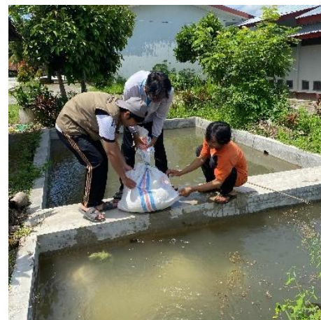
Gambar 3. Proses perendaman benih

perendaman benih padi sebelum penyemaian bertujuan untuk meningkatkan daya tumbuh benih lebih dari 85%, mempercepat dan menyeragamkan perkecambahan, menekan risiko serangan hama serta penyakit tular benih, dan memperkuat vigor tanaman pada fase awal pertumbuhan [14]. Penelitian lain menunjukkan bahwa perendaman benih padi dalam air selama 24 jam sebelum penanaman memberikan efek positif yang lebih besar dibandingkan perlakuan priming tanpa perendaman [15]. Proses ini diawali dengan menyiapkan kolam perendaman (Gambar 4) yang bersih dan berisi air dengan kedalaman cukup untuk merendam benih secara menyeluruh. Benih yang digunakan adalah varietas Ciliwung dan Impari 32 bersertifikat dengan label putih (benih dasar), yang akan diturunkan menjadi benih pokok berlabel ungu.