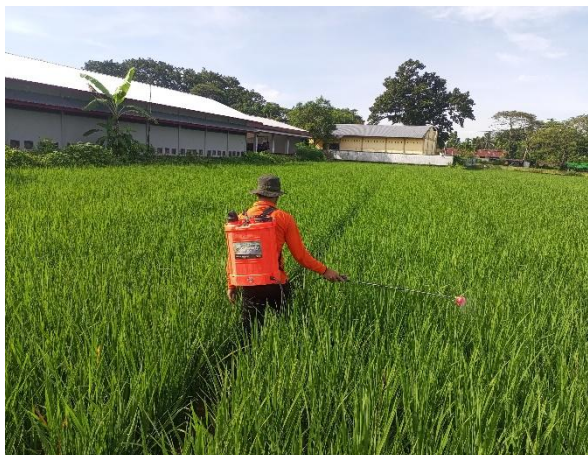
Gambar 12. Penyemprotan Zat Pengatur Tumbuh

Pemupukan (Gambar 14) dilakukan tiga kali dengan menggunakan pupuk Urea (PT. Pupuk Kujang, Karawang, Jawa Barat), SP-36 (PT. Petrokimia Gresik, Gresik, Jawa Timur), dan NPK (PT. Pupuk Kalimantan Timur (PKT), Bontang, Kalimantan timur) dalam perbandingan 1:1:1. Pemupukan pertama dilakukan pada umur 10–15 hari setelah pindah tanam (HSPT), pemupukan kedua pada umur 21–30 HSPT, dan pemupukan ketiga pada umur 45–50 HSPT. Setiap hektar lahan diberikan pupuk sebanyak 300 kg atau enam karung berukuran 50 kg. Pupuk ditaburkan secara merata di sekitar tanaman agar penyerapan unsur hara oleh akar berlangsung optimal.