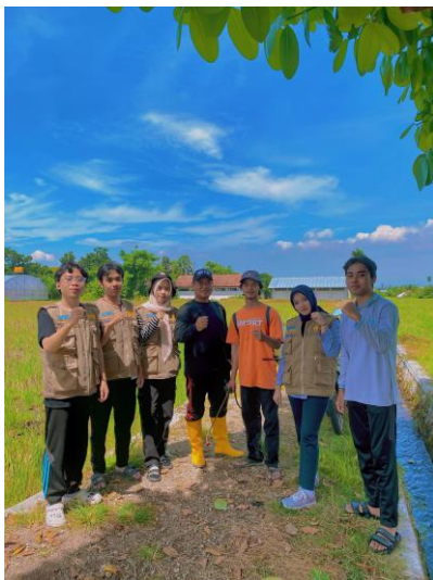
Gambar 28. Sesi Foto Bersama Supervisor