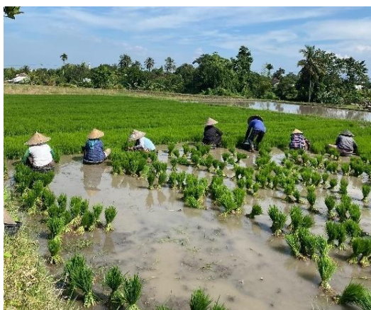
Gambar 7. Proses Pindah Tanam

Pindah tanam padi (Gambar 8) dilakukan setelah bibit mencapai umur ideal, yaitu 21–25 Hari Setelah Semai (HSS). Bibit berumur sekitar 30 hari tidak disarankan karena cenderung menghasilkan pertumbuhan yang kurang baik. Bibit yang terlalu tua sulit beradaptasi dengan lingkungan baru, menghasilkan anakan tidak seragam, memiliki perakaran dangkal, dan pertumbuhan tanaman menjadi tidak optimal [16]. Bibit yang digunakan untuk pindah tanam berasal dari persemaian hasil proses perendaman dan perkecambahan yang telah berjalan optimal. Sebelum penanaman, lahan disiapkan melalui pengolahan tanah secara menyeluruh, termasuk penataan sistem irigasi dan sanitasi untuk menjaga kebersihan dari gulma serta mencegah tercampurnya varietas lain. Permukaan lahan kemudian diratakan menggunakan papan lapet agar sesuai dengan kebutuhan sistem tanam.