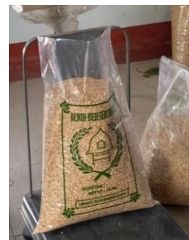
Gambar 18. Kemasan Plastik Kapasitas 10 kg.

Pertanian (BBIP), digunakan kantong plastik berkapasitas 10 kg berbahan Low-Density Polyethylene (LDPE) (Gambar 19). Bahan ini dipilih karena tahan terhadap kelembapan, lentur, ringan, dan cukup kuat menahan beban benih tanpa mudah sobek. Selain itu, plastik PE mampu menahan masuknya udara dan air, sehingga kadar air benih tetap stabil di bawah 13% [34]. Dengan sifat tersebut, kemasan PE efektif menjaga mutu benih selama penyimpanan dan distribusi.