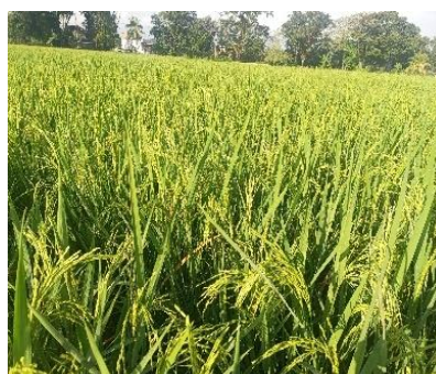
Gambar 14. Padi varietas ciliwung usia 66 HSPT

Melalui kegiatan pemeliharaan yang terstruktur, pertumbuhan tanaman diharapkan berlangsung seragam dan sehat. Saat artikel ini ditulis, tanaman padi varietas Ciliwung telah berumur 66 hari setelah pindah tanam (HSPT) dan memasuki fase generatif awal, sedangkan varietas Impari 32 berumur 46 HSPT. Kedua varietas menunjukkan pertumbuhan yang baik berdasarkan hasil pengamatan di lapangan.