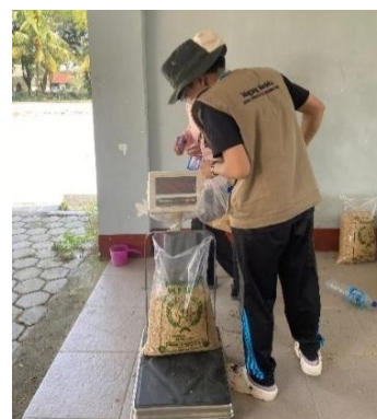
Gambar 19. Proses Pengisian dan Penimbangan Benih

Benih yang telah dibersihkan dan dikeringkan dimasukkan ke dalam kantong plastik transparan berkapasitas 10 kg, kemudian ditimbang menggunakan timbangan digital (Gambar 20).