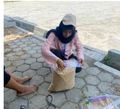
Gambar 24. Pemberian Label pada Benih

tidak melalui sertifikasi formal, benih ini tetap memiliki kemampuan adaptasi tinggi terhadap kondisi lingkungan lokal.