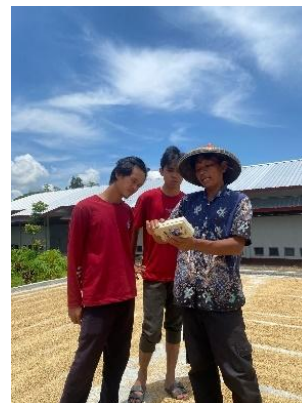
Gambar 16. Pengukuran Kadar Air Benih Padi

Pengukuran kadar air merupakan tahap penting dalam proses pascapanen benih karena kadar air yang terlalu tinggi dapat menurunkan mutu, mengurangi viabilitas, serta meningkatkan risiko serangan jamur dan kerusakan selama penyimpanan. Berdasarkan Standar Nasional Indonesia (SNI) 6233:2015 tentang Benih Padi Inbrida, kadar air maksimum yang diperbolehkan untuk benih siap simpan adalah 12% [31]. Kadar air padi saat panen umumnya masih tinggi, yaitu sekitar 20–23%. Pada kadar tersebut, padi tidak aman disimpan karena bijinya dapat berkecambah. Agar aman disimpan, padi perlu dikeringkan hingga kadar air mencapai 12% [32]. Oleh sebab itu, pengendalian kadar air menjadi indikator mutu penting yang harus diawasi dengan ketat sebelum benih dikemas dan disertifikasi.