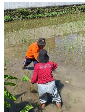
Gambar 10. Proses Penyulaman Tanaman Padi

Pemeliharaan tanaman padi merupakan tahap penting dalam budidaya yang bertujuan mendukung pertumbuhan optimal serta memastikan hasil panen dan mutu benih sesuai standar sertifikasi [24]. Kegiatan pemeliharaan dilakukan sejak awal masa tanam hingga tanaman memasuki fase generatif. Mahasiswa PKL MBKM berperan langsung dalam berbagai kegiatan pemeliharaan, termasuk penyulaman, penyiangan, pengairan, pemupukan, serta pengendalian hama dan penyakit tanaman.