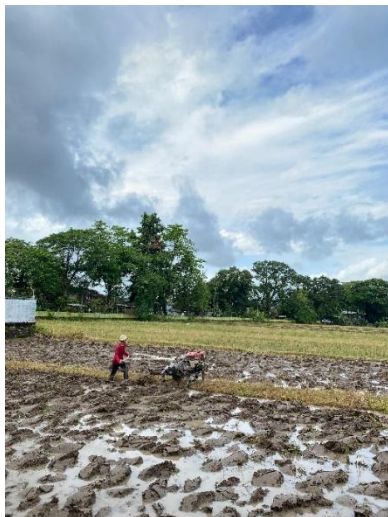
Gambar 2. Pengolahan lahan menggunakan hand tractor

mempersiapkan media tanam yang sesuai dengan standar budidaya benih bersertifikat. Pengolahan lahan ini merupakan tahap awal yang sangat penting karena menentukan kesiapan tanah dalam mendukung pertumbuhan tanaman padi. Proses pengolahan dilakukan dua kali, yaitu pembajakan pertama untuk membalik tanah dan pembajakan kedua untuk mengemburkannya (Gambar 3). Proses pembajakan secara mekanis dengan traktor lebih efektif dalam memperbaiki struktur tanah dibandingkan cara manual [13]. Tujuan utamanya adalah memutus sisa akar tanaman sebelumnya, memperbaiki aerasi tanah agar akar padi dapat tumbuh optimal, serta membantu pengendalian gulma dan mempercepat dekomposisi bahan organik di dalam tanah.