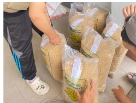
Gambar 21. Label Putih

Label putih (Gambar 22), atau benih dasar, merupakan benih yang dihasilkan langsung oleh penangkar dan memiliki kemurnian genetik tertinggi [46]. Benih ini digunakan sebagai sumber awal untuk memperbanyak benih kelas berikutnya. Meskipun lebih mudah ditemukan dibanding benih berlabel kuning, benih putih tetap jarang di pasaran dan harganya jauh lebih tinggi dibanding benih berlabel ungu atau biru.