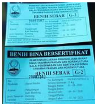
Gambar 23. Label Biru

Label biru (Gambar 24) menunjukkan benih sebar yang diproduksi oleh masyarakat dengan sumber benih dari benih pokok [46]. Benih berlabel biru sudah diperbolehkan disebarluaskan ke masyarakat sebagai benih padi konsumsi dan mudah ditemukan di kios-kios pertanian.