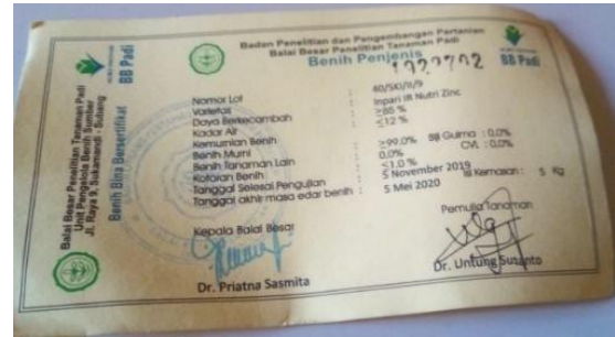
Gambar 20. Label Kuning (Sumber: [47])

Label kuning (Gambar 21) menunjukkan benih penjenis yang diproduksi oleh penangkar dengan tingkat kemurnian genetik tertinggi [46]. Karena jumlahnya sangat terbatas, benih label kuning jarang disebarluaskan dan hampir tidak ditemukan di pasaran.