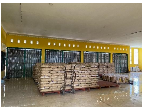
Gambar 26. Showroom Distribusi Benih

Showroom Distribusi Benih (Gambar 27) merupakan fasilitas pendukung milik Balai Benih Induk Pertanian (BBIP) Narmada yang berfungsi sebagai tempat penyimpanan sekaligus ruang tampilan berbagai jenis benih unggul siap distribusi. Showroom ini dirancang untuk memperlihatkan mutu fisik kemasan, jenis varietas benih, dan informasi penting lain yang tercantum pada label kepada petani, kelompok tani, maupun pihak terkait.