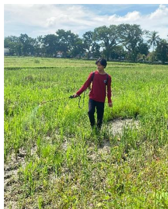
Gambar 1. Sanitasi Lahan

Sanitasi lahan yang efektif akan menciptakan kondisi tanah yang bersih dan siap diolah, meminimalkan persaingan antara gulma dan tanaman padi dalam penyerapan unsur hara, serta menjaga keseragaman varietas. Keberadaan CVL pada lahan produksi benih sangat berisiko terhadap hasil akhir karena dapat menyebabkan kegagalan dalam uji sertifikasi benih oleh lembaga pengawas terkait.