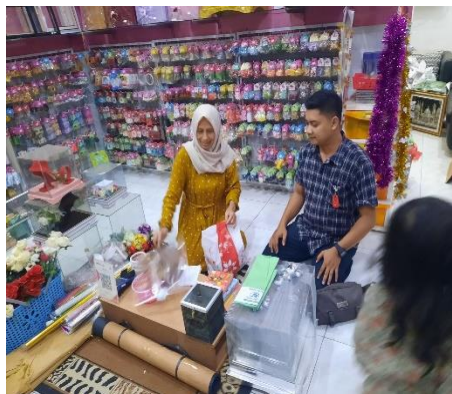
Gambar 1. Dokumen Pribadi Pembelian Alat Hantaran.

Sebagai bahan baku pembuatan kerajinan limbah kulit jagung atau kelobot berupa kulit jagung setelah proses panen yang sudah mengering dan layak untuk dijadikan bahan baku kerajinan, artinya tidak ada kulit yang membusuk atau menghitam. Pemilihan bahan baku ini perlu karena akan berpengaruh terhadap proses pengolahan dan hasil dari kerajinan yang akan dibuat.