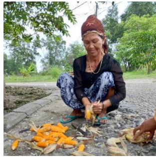
Gambar 2. Dokumen Pribadi Pemilahan Jagung dari Kulit.