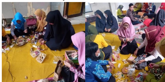
Gambar 4. Dokumen Pribadi Perangkaian Hantaran dengan Kulit Jagung berwarna hitam putih.

Proses perangkaian ini dilakukan dengan cara menggunting kulit jagung, menyatukan pola satu dengan pola yang lainnya untuk membentuk sebuah kerajinan yang diinginkan. Beberapa alat yang digunakan dalam pelatihan pembuatan hantaran bersama guru PAUD Kecamatan Kamal diantaranya kawat.