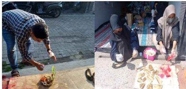
Gambar 3. Proses Pewarnaan Kulit Jagung.

Menurut (Abrido et al., 2012) perendaman serat alam dengan NaOH bertujuan untuk meningkatkan ikatan antara serat dan matrik (pekat). Sedangkan senyawa asam asetat bersifat korosif dan berfungsi untuk mengawetkan, melunakkan sekaligus sebagai kualitas atau pengental. Dalam hal ini perendaman pewarnaan ditujukan untuk memperindah kulit jagung yang akan dijadikan kerajinan. Pewarnaan dilakukan dengan cara memasukkan bahan bahan ke dalam bak yang bersih dan berisi air yang sudah dicampur dengan pewarna tekstil (aci). Setelah itu didiamkan selama 30 menit atau lebih agar warnanya meresap ke kulit jagung tersebut. Semakin lama direndam akan semakin bagus hasilnya.