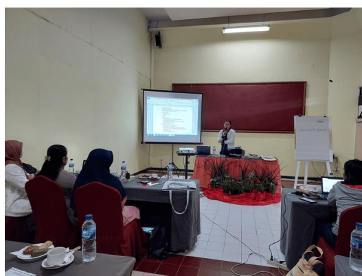
Gambar 6. Guru Mitra Melakukan Sesi Berbagi Praktik Baik