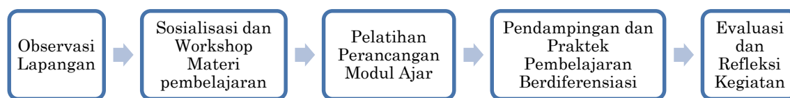
Gambar 1. Tahapan Pelaksanaan Kegiatan PBM

tim yang membantu dan mendampingi peserta dalam menyusun modul ajar terintegrasi pembelajaran berdiferensiasi berbasis profil pelajar pancasila. Tahapan kegiatan PBM tersaji pada Gambar 1.