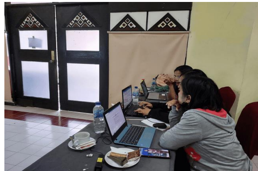
Gambar 2. Guru Mitra Saling Berkolaborasi dan Berdiskusi Merancang Modul Ajar Pembelajaran Berdiferensiasi

berbasis profil pelajar pancasila pada kegiatan sosialisasi yang tersaji pada Gambar 2.