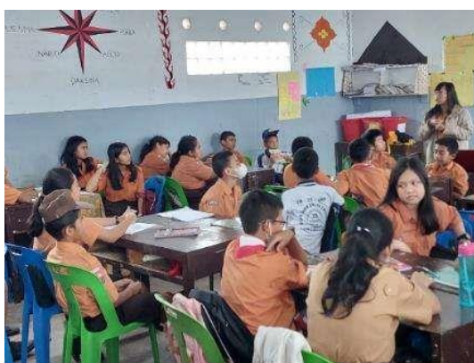
Gambar 5. Guru Mitra Melakukan Praktek Pembelajaran Berdiferensiasi