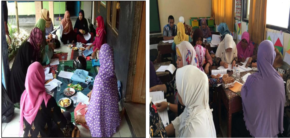
Gambar 2. Pelaksanaan Pengabdian.

dengan beralih ke kondisi yang tercipta pada pendekatan Blue Ocean Strategy (Bragança, 2016).