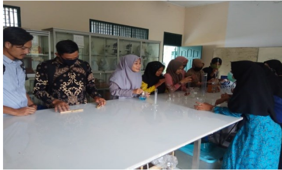
Gambar 1. Pengenalan Beberapa Alat Laboratorium