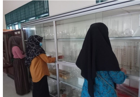
Gambar 2. Demonstrasi Cara Penyimpanan Alat Laboratorium