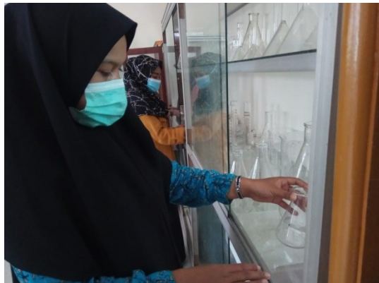
Gambar 3. Tata Cara Pemeliharaan Alat Laboratorium