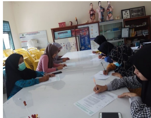
Gambar 4. Calon Guru Sedang Mengisi Angket Tanggapan