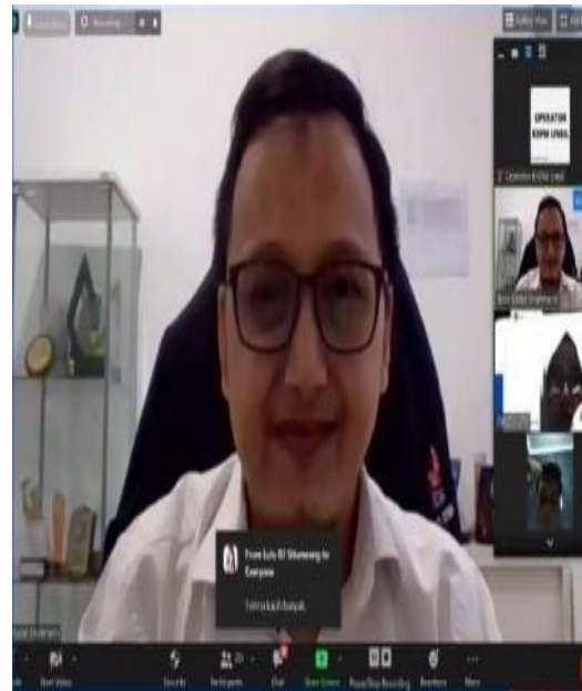
Gambar 6. Foto Bersama Kepala BEI Kantor Perwakilan Jawa Barat Di Akhir Sesi.