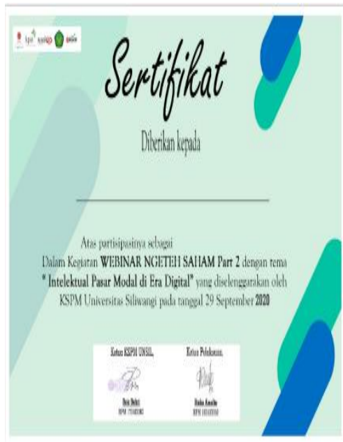
Gambar 5. Contoh E-Sertifikat Peserta Webinar.