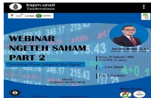
Gambar 8. Publikasi e-flyer di Instagram @kspm.unsil.