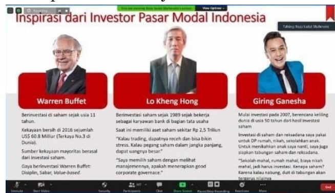
Gambar 2. Pemaparan slide materi mengenai Inspirasi dari Investor Pasar Modal Indonesia.

Bahasan menarik mengenai inspirasi dari investor pasar modal Indonesia, dijelaskan bahwa berbagai macam pelajaran dapat diraih dengan cara melihat dan mempelajari keilmuan para investor, baik dari sisi pengalaman maupun keahliannya.