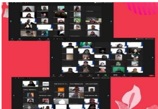
Gambar 7. Sesi Foto Bersama Pemateri, Panitia Dan Seluruh Peserta Webinar.