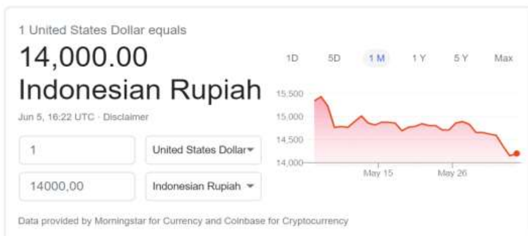
Gambar 1. Tren Kurs Dollar Terhadap Rupiah Terkait Isu-Isu New Normal di Indonesia

Indonesia bersiap untuk memasuki era kenormalan baru atau new normal . Beberapa aktivitas di luar rumah akan kembali diperbolehkan namun dengan penerapan protokol kesehatan yang berlaku. Pada periode new normal harus dilakukan dengan persiapan yang serius dengan memperhatikan berbagai aspek. Seperti sarana atau fasilitas yang mendukung, Adanya kesadaran dan kedisiplinan gaya hidup masyarakat, kemampuan pemeriksaan yang tinggi, dan kesiapan kapasitas sistem kesehatan (Muhyiddin, 2020). Isu-isu terkait new normal di Indonesia dipengaruhi oleh keadaan ekonomi nasional yang memburuk. Maka dengan adanya isu penerapan new normal diharapkan dapat berkontribusi pada perbaikan ekonomi secara nasional (Guridno & Guridno, 2020; Habibi, 2020). Adapun dampak dari mulainya pelanggaran di dalam masyarakat dan dengan adanya isu-isu new normal membuat tren ekonomi mengalami sedikit perbaikan meskipun tidak fundamental. Adapun tren kurs rupiah mengalami tren positif seperti pada gambar berikut: