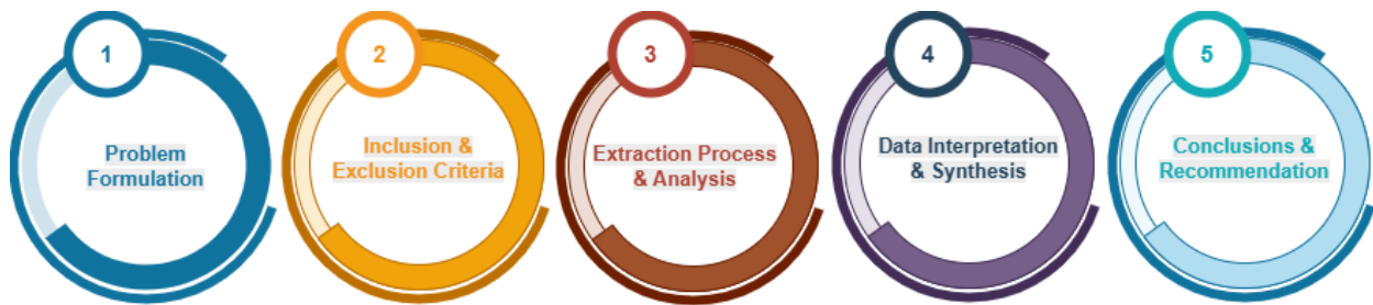
Gambar 1. Diagram Alur Pelaksanaan Penelitian

(akses, kualitas, dan keadilan) dan integritas (nilai, etika, dan akuntabilitas) dalam penyelenggaraan pendidikan. Tahapan proses penelitian disajikan pada Gambar 1.