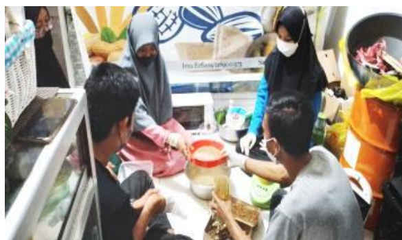
Gambar 4. Proses Pendampingan dan Evaluasi Mitra

Pada tahap pendampingan berjalan sesuai dengan target yang diharapkan, yaitu tidak ada kendala berat yang dihadapi mitra. Proses pendampingan ini juga dilaksanakan bersama dengan proses pendampingan, dimana mitra pada akhir kegiatan mampu mengutarakan pendapatnya atau kendala yang ditemuinya ketika membuat biofoam kemasan. Proses pendampingan dilakukan pula evaluasi mengenai peningkatan pengetahuan dan keterampilan mitra secara langsung.