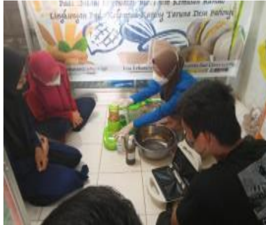
Gambar 3. Pelatihan Pembuatan Biofoam Kemasan

Pada tahap ini Proses pengenalan alat dan bahan baku yang digunakan dalam pembuatan biofoam. Setelah pengenalan alat, tim selanjutnya melakukan pra-pelatihan kepada mitra dengan memberitahukan tahap awala yang dilaksanakan. Kemudian masuk pada tahap pelatihan, pada saat pelatihan tim pelaksana mempraktikkan bagaimana dan apa yang harus dilakukan pada tahap ini tim pelaksana dan mitra sangat berkerja sama serta antusias dalam kegiatan pelatihan.