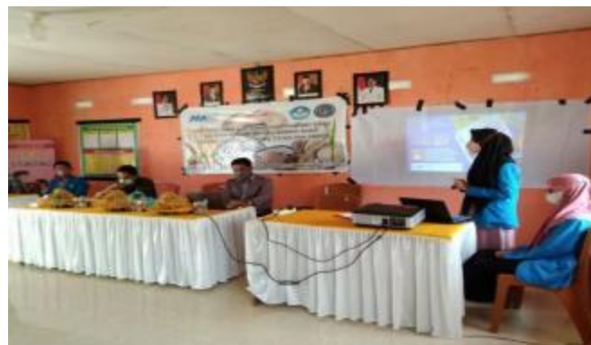
Gambar 2. Proses Penyuluhan Pada Kelompok Karang Taruna Desa Pationgi

Penyuluhan yang dilakukan memberikan dampak positif melalui semangat mitra dalam mengikuti seminar mengenai pemanfaatan limbah kulit kacang tanah dan sekam padi sebagai biofoam kemasan ramah lingkungan.