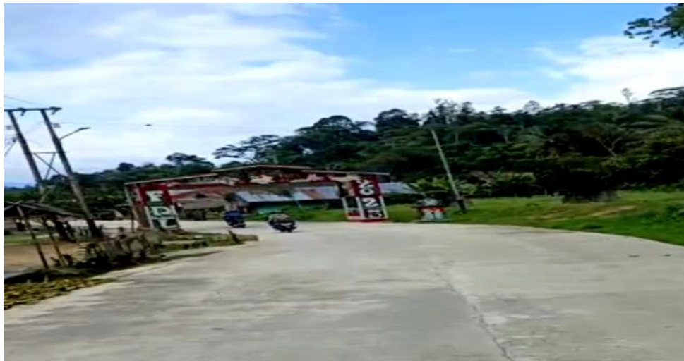
Gambar 4. Kondisi jalan menuju area festival