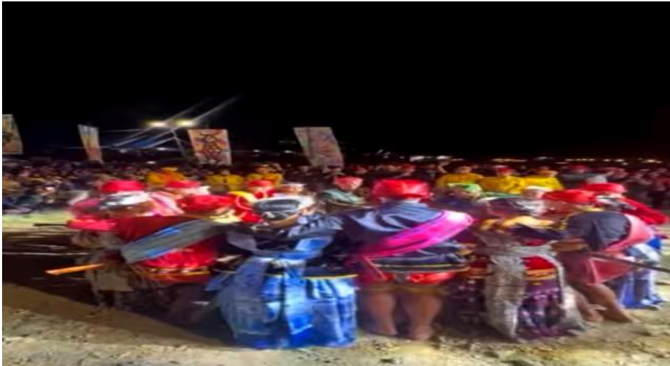
Gambar 2. Tarian tradisional Raego pada malam pembukaan festival

Selain berfungsi sebagai ruang pelestarian budaya, festival ini menjadi arena interaksi yang mempertemukan masyarakat lokal dengan pengunjung dari berbagai daerah. Interaksi tersebut menghadirkan ruang pertukaran pengalaman budaya yang menguntungkan kedua belah pihak. Bagi masyarakat Lindu, interaksi ini memperkuat rasa percaya diri terhadap warisan budayanya, sedangkan bagi pengunjung, pengalaman tersebut menjadi kesempatan berharga untuk memahami nilai-nilai budaya yang hidup dan dijalankan secara nyata. Dengan demikian, festival ini tidak hanya dipandang sebagai agenda rekreasi, tetapi juga sebagai media edukasi budaya yang membangun pemahaman lintas komunitas. "Festival ini memiliki daya tarik yang kuat karena ia tidak berhenti pada hiburan, tetapi menghadirkan narasi tentang identitas dan warisan. Acara adat, pertunjukan seni, dan ekspresi masyarakat lokal memberi pengalaman estetik sekaligus edukatif. Ia mengingatkan saya bahwa kebudayaan bukan sekadar tontonan, tetapi juga tuntunan yang membentuk karakter bangsa." (Hasil wawancara, Informan 6, 20-07-2025).