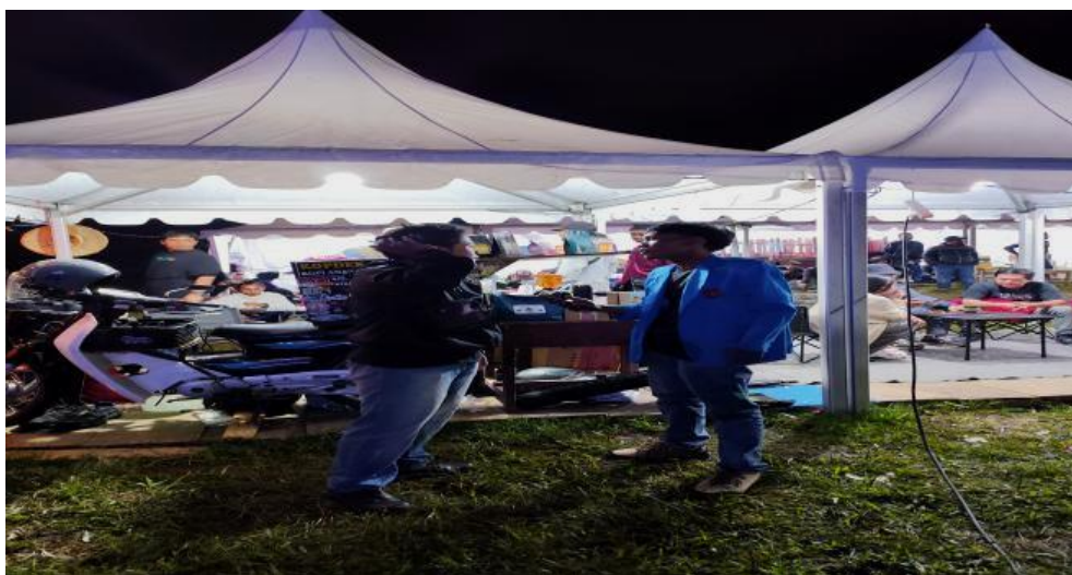
Gambar 3. Kegiatan wawancara di stand UMKM penjual Kopi

yang menguntungkan bagi UMKM lokal. “Untuk keuntungan per hari bisa sampai 1 juta, kalau sampai hari penutupan festival, totalnya 5 juta. Menurut saya, festival ini sangat menguntungkan bagi para pelaku UMKM dan kepada masyarakat, karena memberikan dampak yang positif, yang mana pendapatan pada festival itu yang angkanya lumayan besar daripada hari biasa.” (Hasil wawancara, Informan 8, 20-07-2025). “Hari pertama kira-kira dapat Rp. 600 ribu, hari kedua sekitar Rp. 1,2 juta, dan hari ketiga yang paling ramai bisa sampai Rp. 1,5 juta lebih. Jadi totalnya sekitar Rp. 3 juta lebih selama festival, kalau di hari biasa penghasilan saya tidak sampai segitu, mungkin hanya ratusan ribu saja. Jadi selama festival pendapatan jauh lebih besar, bisa berkali-kali lipat dari biasanya.” (Hasil wawancara, Informan 9, 20-07-2025).