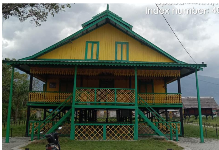
Gambar 2. Rumah Adat Souraja Tampak Depan