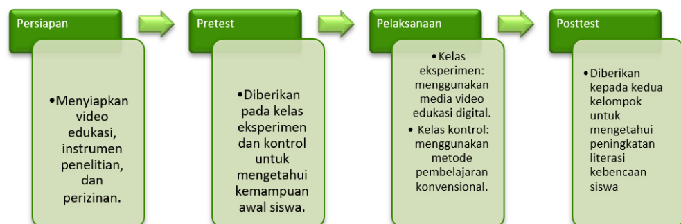
Gambar 2. Tahap Pelaksanaan Penelitian

Pelaksanaan penelitian dilakukan dari tanggal 6-8 Oktober 2025 melalui beberapa tahap, yaitu: