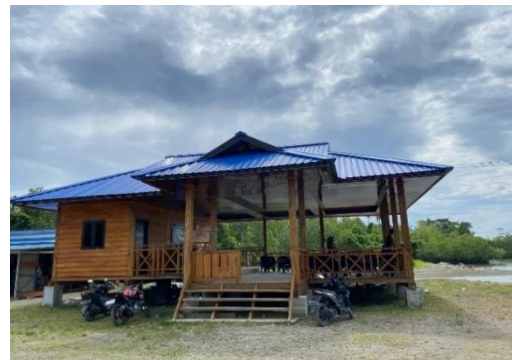
Gambar 2. Baruga

Potensi wisata Pantai Manui tidak hanya terletak pada keindahan alamnya, tetapi juga pada aspek sosial-budaya masyarakat lokal yang turut berperan aktif dalam mengelola kawasan wisata ini. Interaksi masyarakat dengan wisatawan berlangsung secara ramah dan terbuka, mencerminkan nilai-nilai gotong royong dan kebersamaan yang menjadi ciri khas masyarakat Desa Membuke.