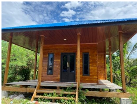
Gambar 1. Mushola

Beberapa fasilitas yang tersedia di wisata pantai manui adalah gazebo, warung, mushola, baruga, toilet, dan pos pengamanan yang ada di Pantai Manui. Dua dokumentasi dari fasilitas di Pantai Manui dapat dilihat di bawah ini