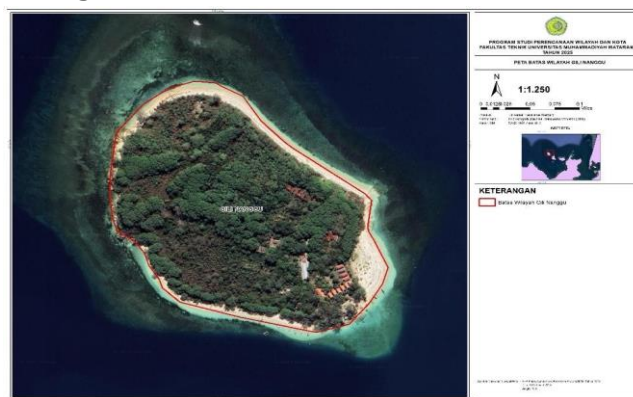
Gambar 1. Peta Lokasi Penelitian Gili Nanggu

Pulau Gili Nanggu merupakan salah satu pulau kecil yang terletak di wilayah pesisir Kabupaten Lombok Barat, Provinsi Nusa Tenggara Barat, dan secara administratif termasuk dalam Kecamatan Sekotong. Pulau ini berada di kawasan perairan barat daya Pulau Lombok dan menjadi bagian dari gugusan pulau-pulau kecil yang berkembang sebagai destinasi wisata bahari. Secara geografis, posisi Pulau Gili Nanggu relatif strategis karena berada pada jalur pergerakan wisata bahari di wilayah Sekotong.